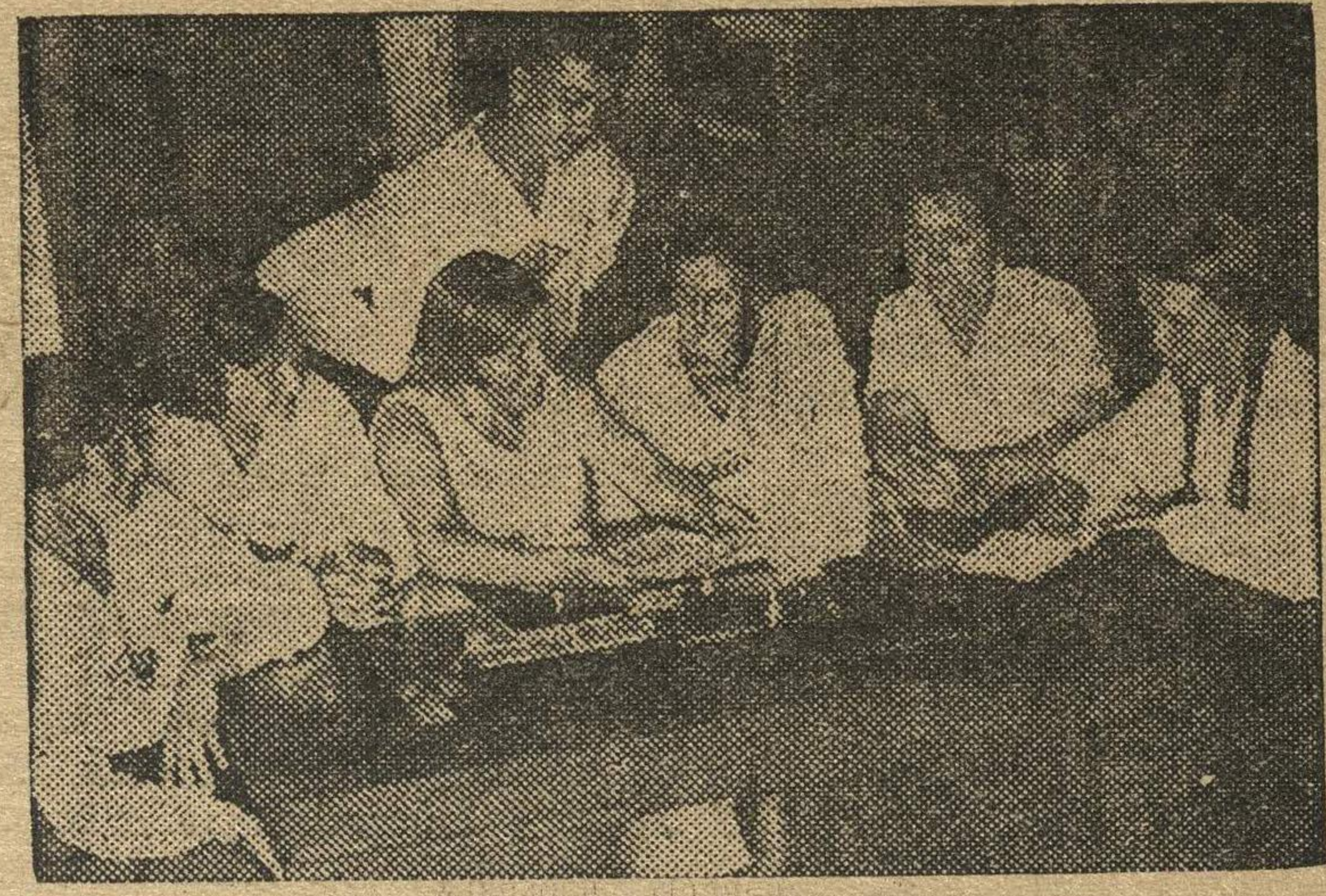
Группа девушек фабрики № 4 Швейпрома во время отпуска идет пешком в подшефный колхоз «Алга», Сергачского района.