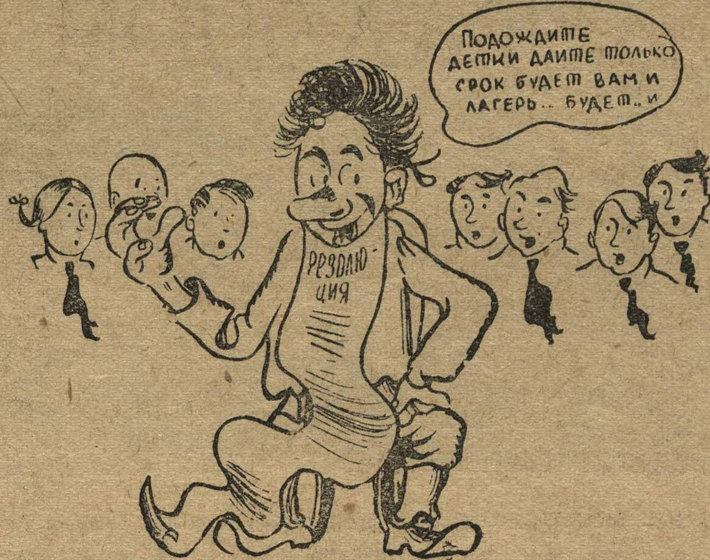
«Детские сказки» Чувашского Наркомпроса.

Работники РОНО и райкомов ВЛКСМ этих районов свое безделье в вопросах оздоровительной работы пытаются прикрыть разговорами об отсутствии средств,