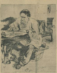
ЛЕВ НИКОЛАЕВИЧ ТОЛСТОЙ. С рисунка работы худ. И. Е. Репина. (1891 г.).

110 лет назад, 28 августа (9 сентября по юл. ст.) 1828 г. в Язвинском поместье близ Тулы родился Лев Николаевич Толстой. Его детство прошло в родовом имении Хлевино, в котором он прожил до 1852 года. Толстой начал учиться в Казанском университете, в котором окончил в 1854 г. и в котором в 1856 г. по окончании курса он устроился на работу в Министерство юстиции. В 1857 г. он женился на Софье Андреевне Толстая, вдовой князя Шаликова. В 1862 г. Толстой переехал в имение Ясная поляна, где он прожил до конца жизни. Толстой был одним из крупнейших русских писателей, философов, публицистов, педагогов, общественных деятелей. Его творчество оказало огромное влияние на русскую культуру и мировую литературу.