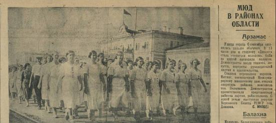
Демонстрация молодежи гор. Германа в честь XXIV Международного юбилейного дня 8 сентября 1938 г. На снимке: молодежь Свердловского района празднует юбилей.

В этот день завод имени Сталина будет работать в усиленном режиме.