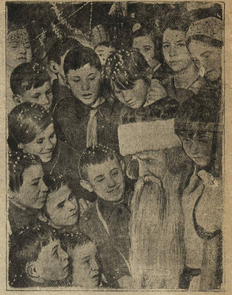
Ребята с Дедом-морозом.

Около 2 тысяч ребят посетили 1 января общегородскую елку. И всем она очень понравилась. Замечательная елка — вот общее мнение всех ребят.