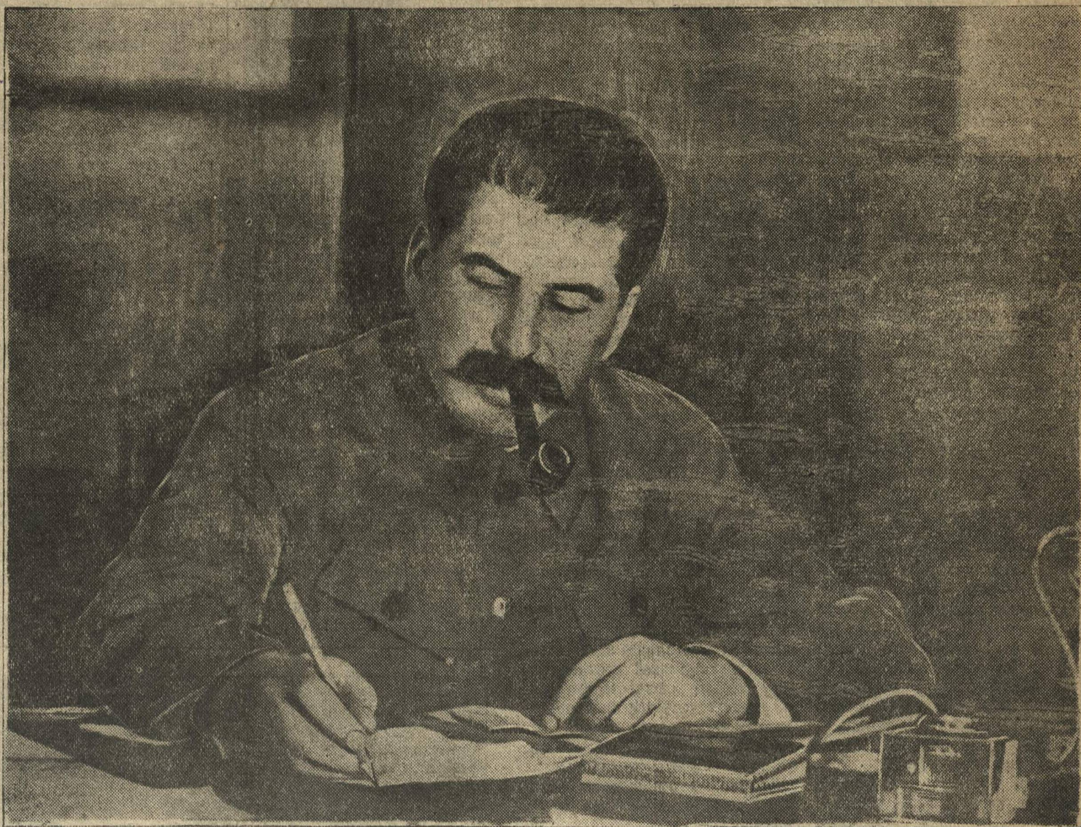
Товарищ И. В. Сталин на совещании передовых колхозников и колхозниц Таджикской ССР и Туркменской ССР с руководителями партии и правительства в Кремле (4 декабря 1935 года).

Текст этих указов Верховного Совета СССР будет опубликован в следующем номере «Ленинской смены».