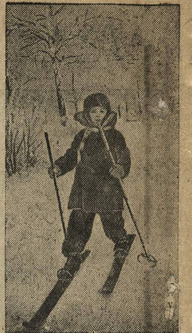
На прогулке в Пушкинском саду.