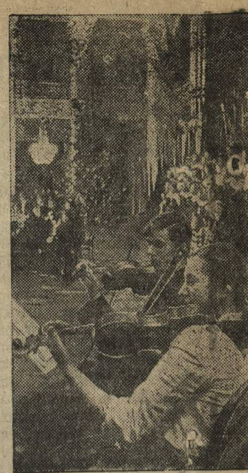
7 января в Ленинградской государственной филармонии силами испанских детей — участниц кружков художественной самодеятельности Ленинградского дворца пионеров — был дан концерт, переданный по радио в республиканскую Испанию. НА СНИМКЕ: выступление хора и оркестра.

12 января состоялась вторая встреча мастеров конькобежного спорта.