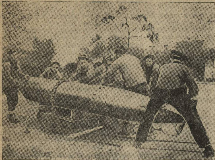
Итальянские притязания на французские территории вызвали со стороны Франции ряд мероприятий по укреплению границ французских владений в Африке. НА СНИМКЕ: французские моряки за переноской торпеды в г. Бизерте (Тунис).