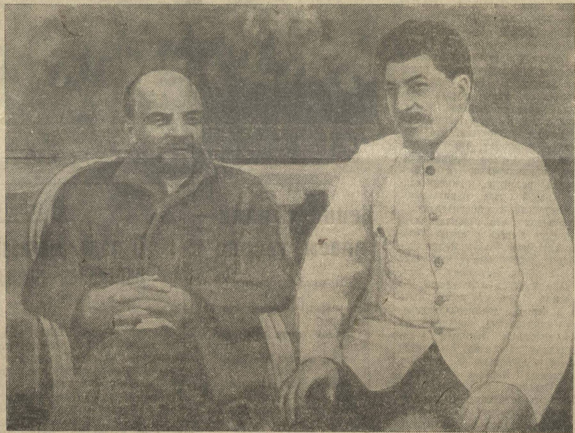
Ленин и Сталин в Горках.

Всемирно-историческая победа социализма в СССР—триумф великого учения Маркса—Энгельса—Ленина—Сталина.