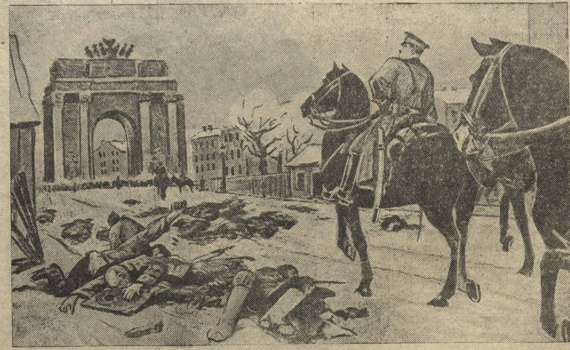
9-е января 1905 года в Петербурге. Расстрел рабочей демонстрации у Нарвских ворот. Картина художника М. И. Авилова (Ленинград).

Тогда 3 января *) путиловцы начали забастовку и предъявили широкие экономические требования: 8-часовой рабочий день,