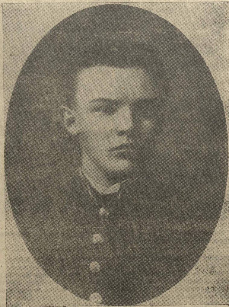
В. И. Ленин — гимназист (1887 г.).