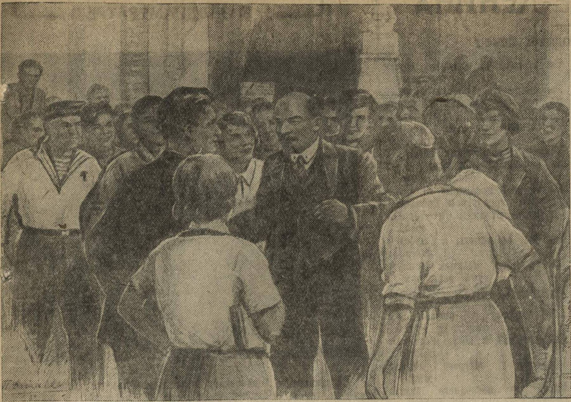
Б 15-летию со дня смерти Владимира Ильича Ленина. На снимке: В. И. Ленин среди делегатов III Всероссийского съезда комсомола (1920 г.).