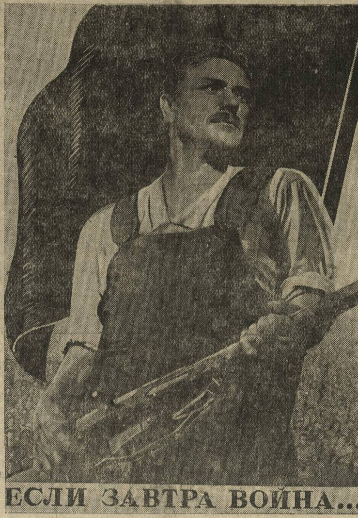
ЕСЛИ ЗАВТРА ВОЙНА...

Делегаты конференций должны точно установить, что сделал райком, чтобы «внедрить в сознание каждого комсомольца понимание того, что быт неотделим от политики, что моральное разложение ведет к гибели комсомольца, как политического и общественного работника, и что моральная чистота работников является надежной гарантией от политического разложения».