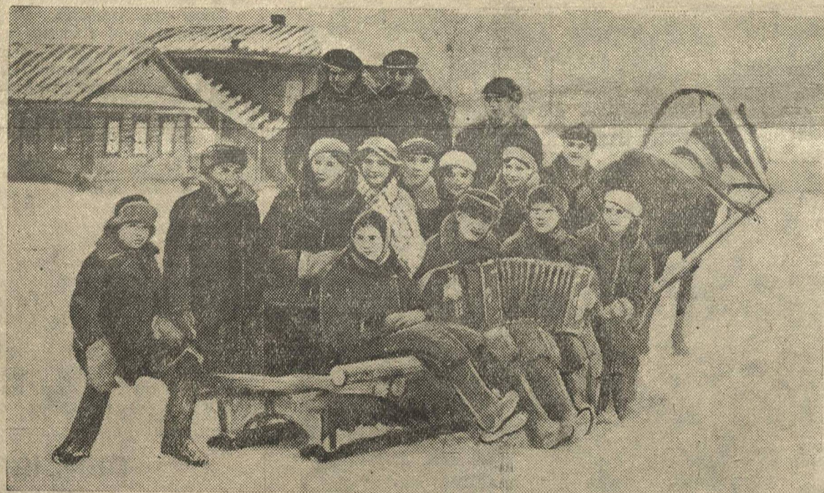
В выходной день в селе Каменки Богородского района.