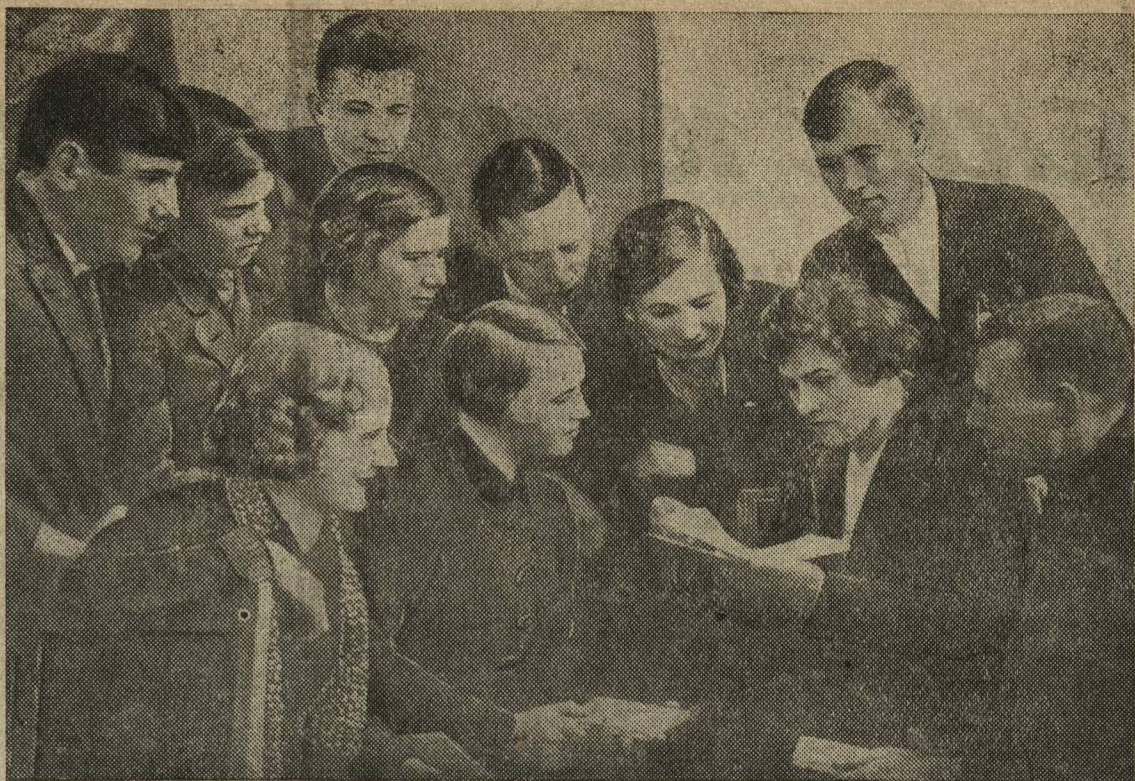
Группа делегатов V Горьковской городской конференции ВЛКСМ от Сормовского района.

ПАРИЖ, 10 февраля. Как сообщает Гавас, в ночь с 8 на 9 февраля франко-испанскую границу начали переходить республиканские механизированные части. Республиканские части под командой полковников Баррио, Модесто и Ластера попрежнему оказывают упорное сопротивление войскам интервентов, прикрывая эвакуацию во Францию гражданского населения и военного снаряжения.