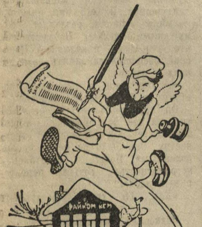
Рис. П. Головина.

Инструкторы обкома ВЛКСМ, бывая в комсомольских организациях, не оказывают ни необходимой помощи. По возвращении из кратковременных командировок они ищут обширные докладные, регистрируя всем известные факты.