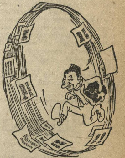
Рис. П. Головина.

...Он, кажется, из кожи в себя да только все вперед не подается, как белка в колесе.