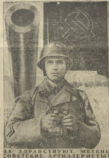
Плакат работы художника В. Корещко, подготовленный к печати издательством «Искусство».