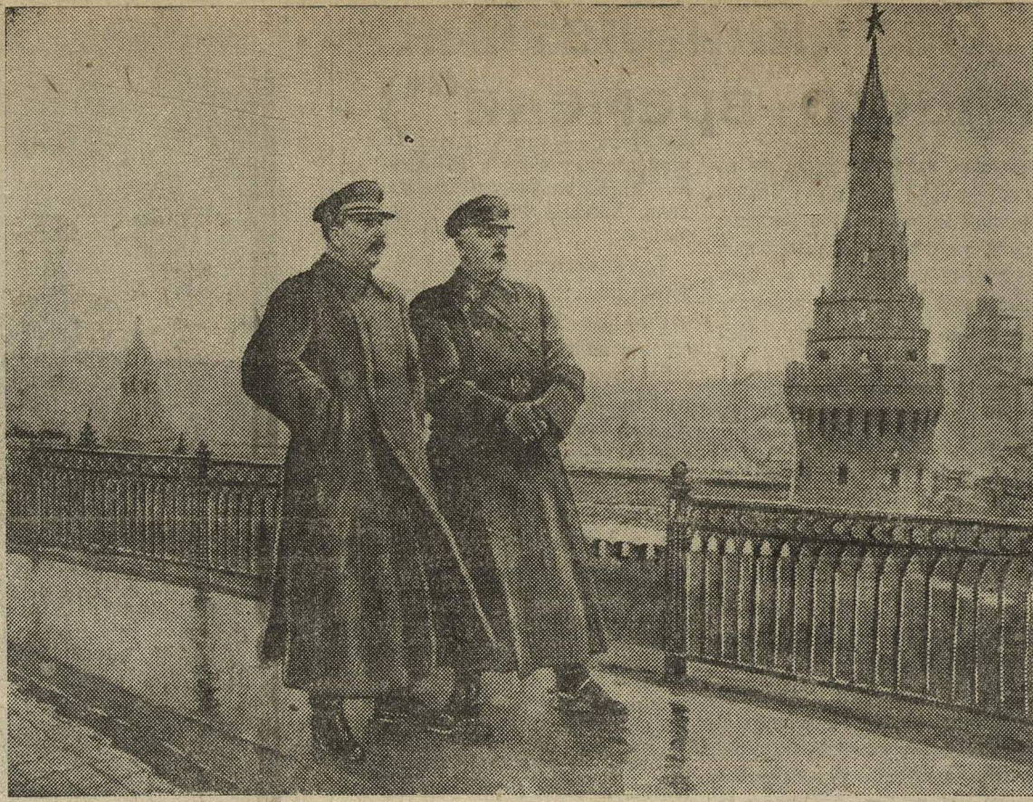
К XXI годовщине Красной Армии и Военно-Морского Флота. НА СНИМКЕ: И. В. Сталин и К. Е. Ворошилов.

Выходящая из Рейхенберга (главный город Судетской области) фашистская газета «Цейт» требует отставки генерала Сыровы. Как сообщает из полуофициальных источников, генерал Сыровы во время обсуждения военного бюджета угрожал отставкой.