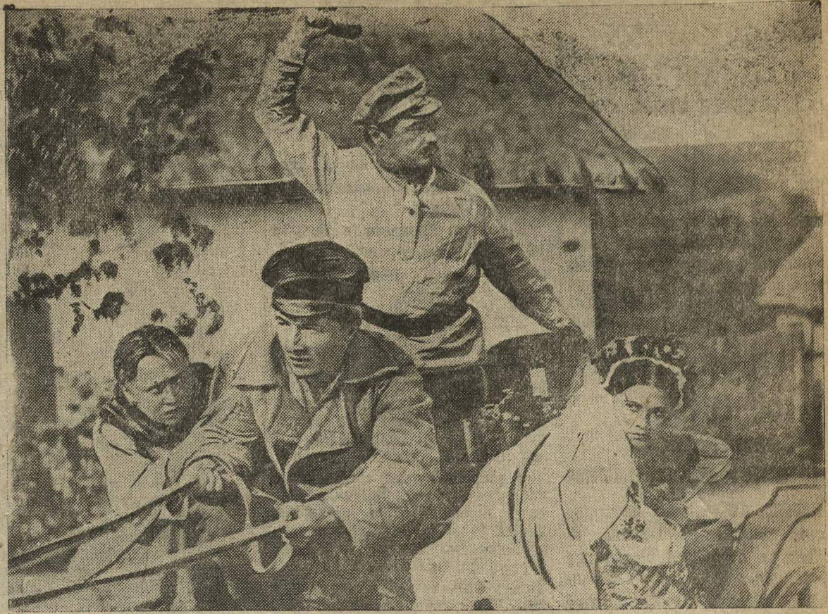
В XXI годовщине Красной армии и Военно-Морского флота Союздетфильм заканчивает новый художественный звуковой фильм «Шел солдат с фронта». Сценарий писателя-орденоносца В. Катаева. На снимке: кадр из фильма.