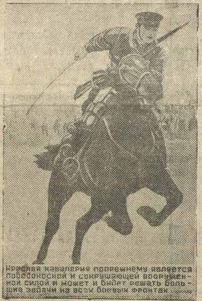
Плакат художника Зелихмана, выпущенный Воениздатом.