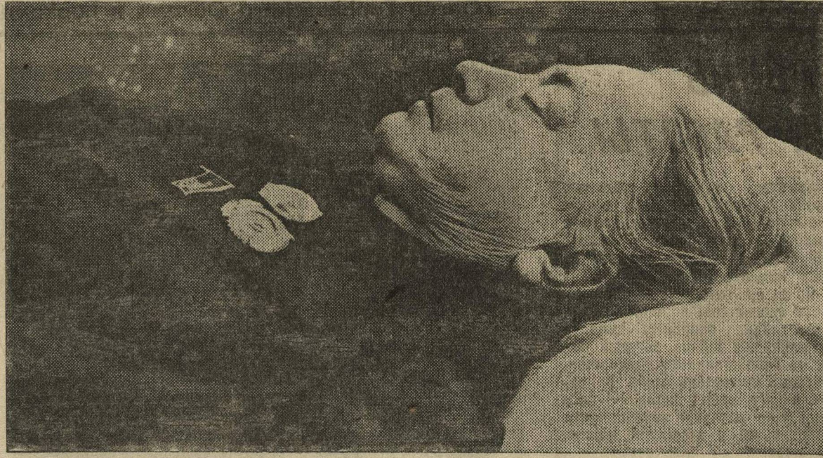
27 февраля скончалась Надежда Константиновна Крупская, член ЦК ВКП(б) и член Президиума Верховного Совета СССР. На снимке: Надежда Константиновна Крупская на смертном одре.

По окончании траурного собрания товарищи П. В. Сталин, В. М. Молотов, Л. М. Каганович, Е. В. Ворошилов, М. П. Калинин, А. И. Микоян, А. А. Андреев, М. Ф. Шкирятов, Емельян Ярославский, А. С. Шербаков бережно подняли траурный катафалк с урной и повели его к Кремлевской стене, которая навсегда приняла прах старейшего члена большевистской партии, ближайшего друга и помощника Ленина, члена ЦК ВКП(б) и Президиума Верховного Совета СССР Н. К. Крупской. (ТАСС).