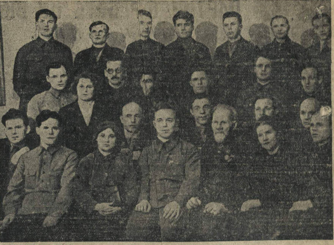
Группа делегатов на XVIII съезде ВКП(б) от Горьковской областной партийной организации.

В. СМЕРНОВ, секретарь Шарьинского РК ВЛКСМ.