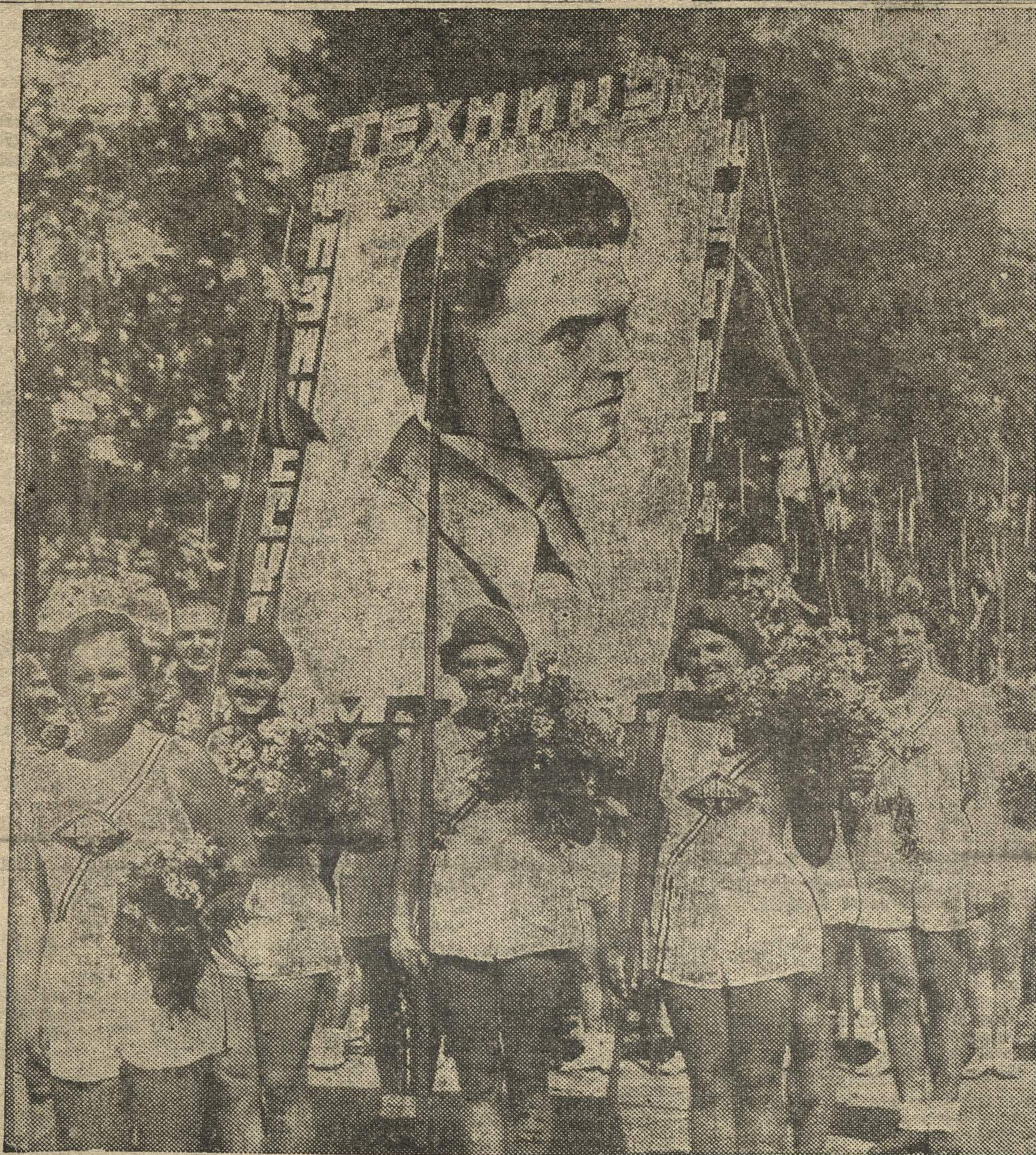
Парад открыли студенты краевого техникума физкультуры им. тов. ПРАМНЭКА.

Орган Горьковского Крайкома и Горкома ВЛКСМ