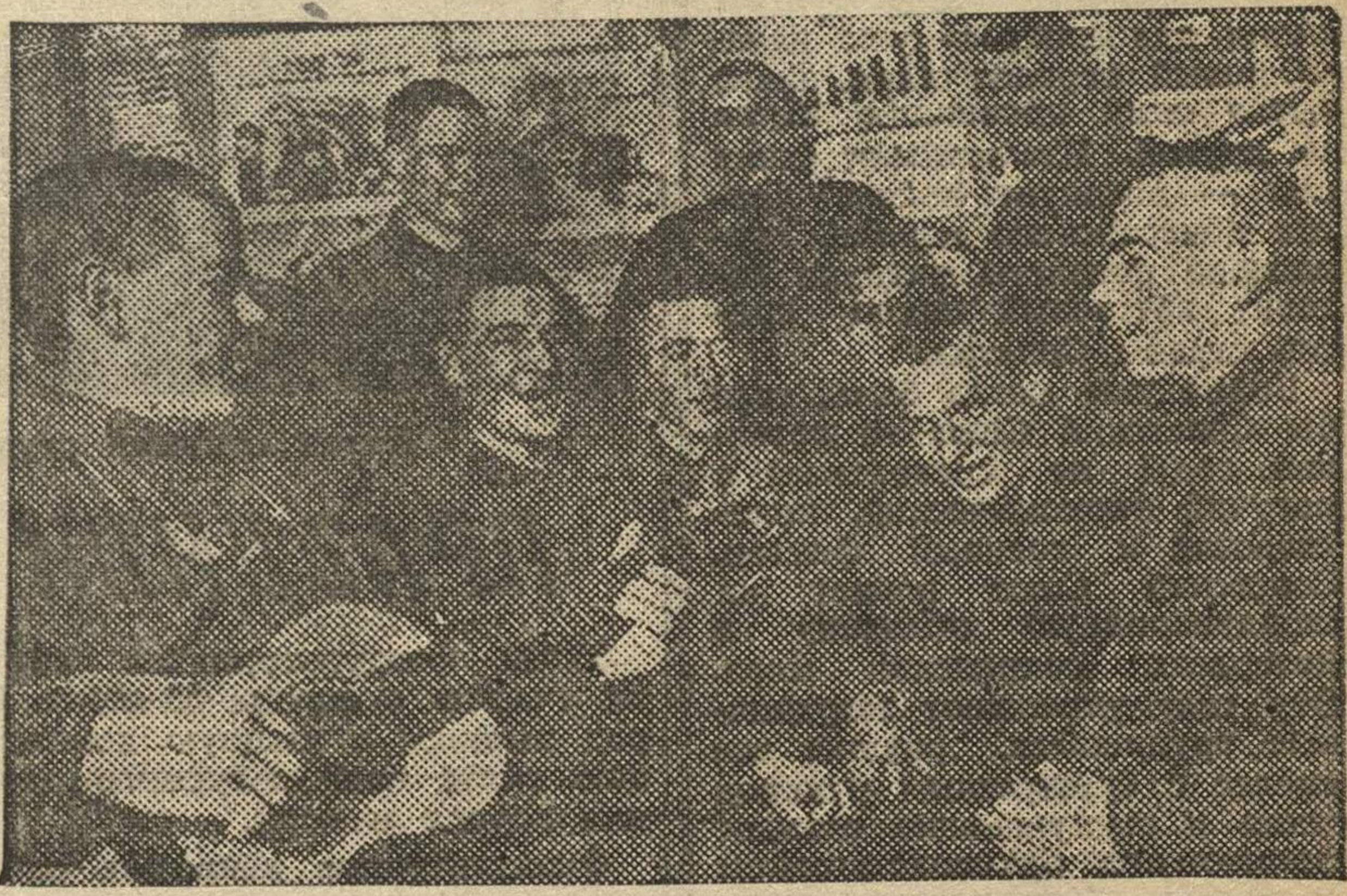
На снимке: красноармейцы разучивают песню в часы досуга.

страной всего мира. Для этого ей необходимо завоевать новые тер- ритории, за счет которых можно увеличить прибыль капиталистам и усилить свое могущество. Фаши- сты считают, что самая подхо- дящая для завоевания страна — это Советский Союз. Победить его — это значит получить в подчине- ние богатую страну и уничтожить отечество пролетариата, родину социализма.