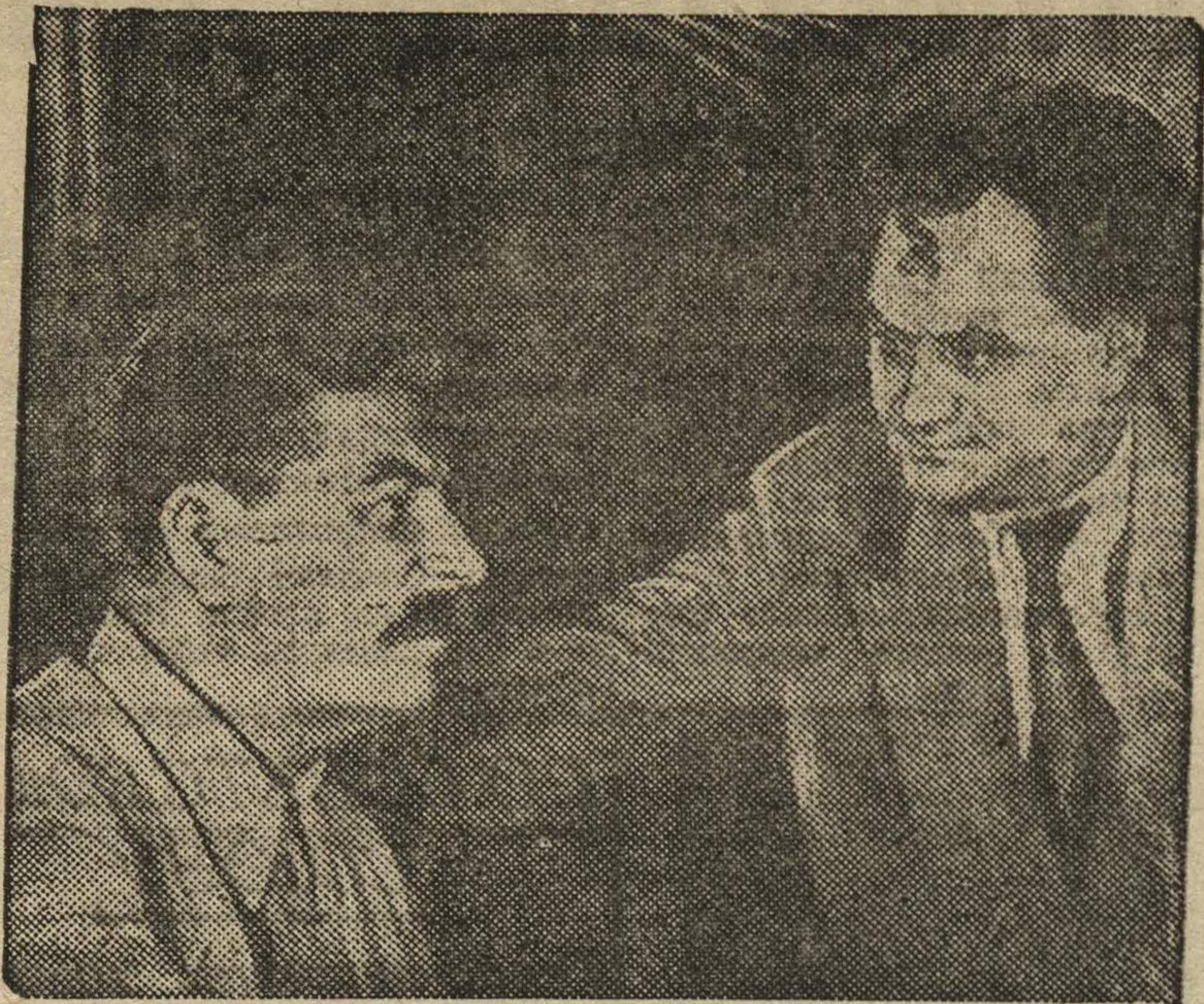
Г.г. Сталин и Димитров в президиуме конгресса Коминтерна.

На вечернем заседании 29 июля председательствует тов. Марти.