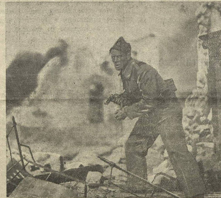
В кинотеатре «Рекорд» демонстрируется новый звуковой художественный антифашистский фильм «Борьба продолжается». НА СНИМКЕ: кадр из фильма.