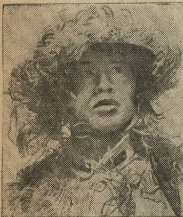
Замаскированный младший командир китайской армии.

РИМ, 14 апреля. (ТАСС). Агентство Стефани сообщает, что итальянское правительство приняло закон, по которому итальянский король принимает албанскую корону. Король будет представлен в Албании генерал-лейтенантом, резиденция которого будет находиться в Тирране.