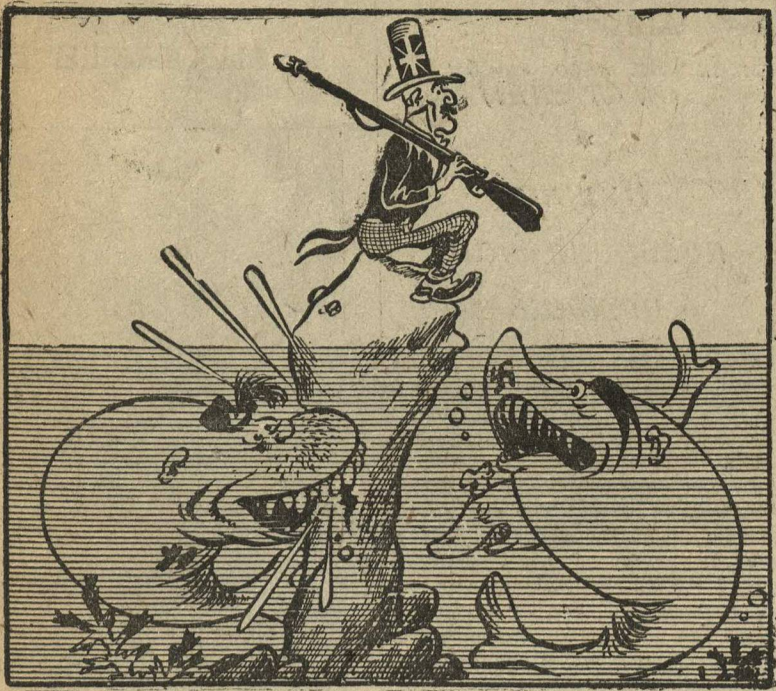
— Нам угрожает опасность? Не вижу...