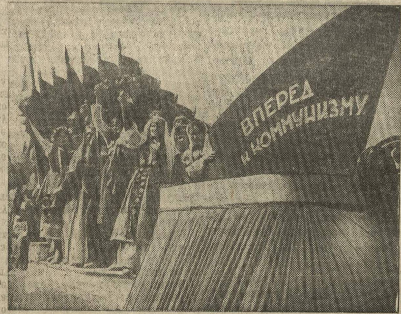
1 мая на площади Челюскинцев. НА СНИМКЕ: в колонне Свердловского района.