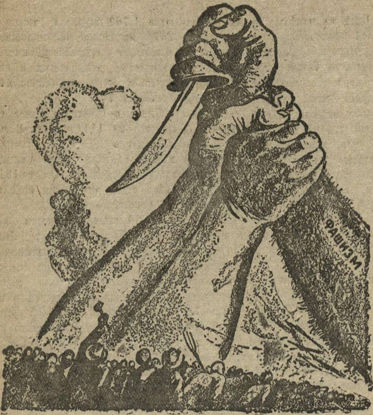
За единый фронт против фашизма. Рис. Фреда Элисса.