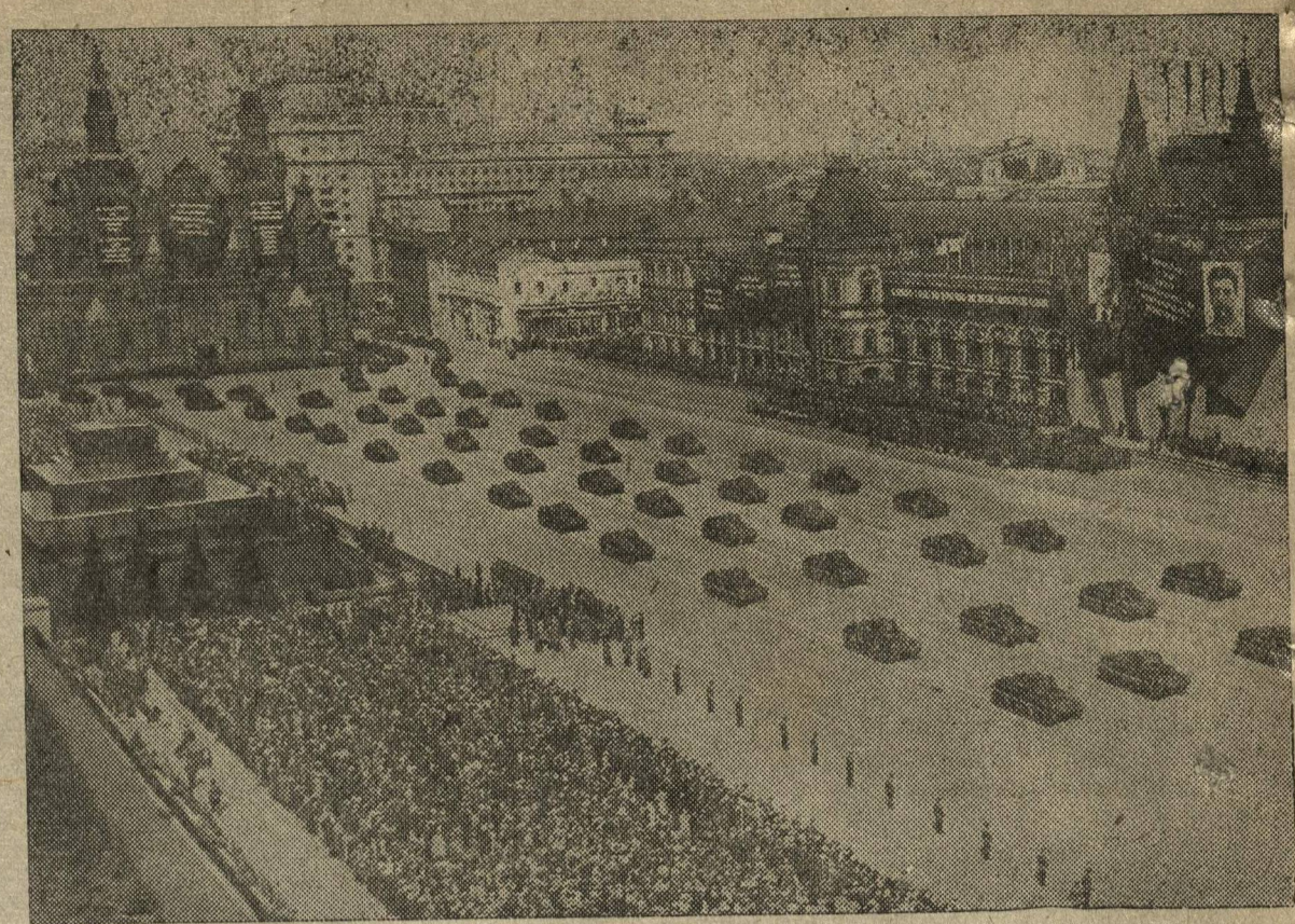
Парад частей Рабоче-Крестьянской Красной Армии и Военно-Морского Флота 7-го мая на Красной площади в Москве. НА СНИМКЕ: танки на параде.

В Горьком будет организовано несколько бесед работников МХАТ'а с актерами вашего города, интелли-