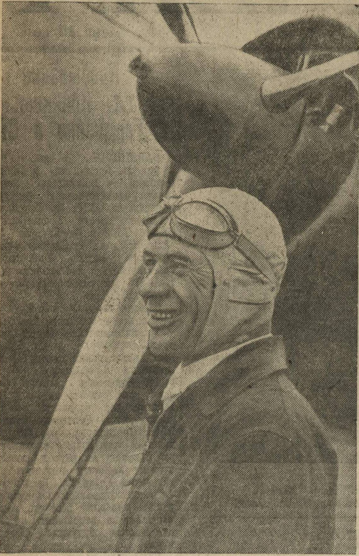
Командир самолета «Москва», Герой Советского Союза В. Н. Коккинаки.