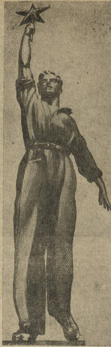
Скульптура, венчающая здание советского павильона на международной выставке в Нью-Йорке. Автор-скульптор В. А. Андреев.

Борис Чкалов начал учебу в бронетанковом училище.