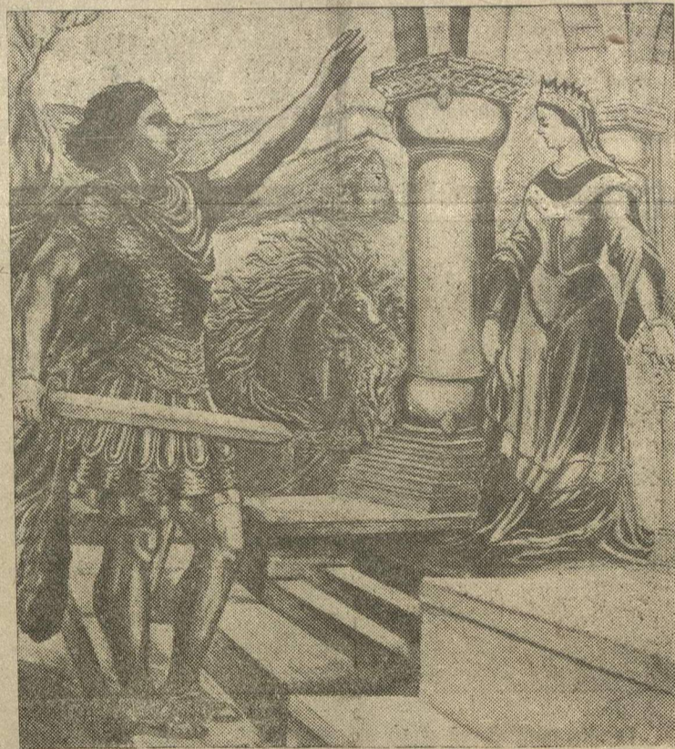
Одна из иллюстраций (работа художника Мамаджания) к юбилейному изданию книги «Давида Сасунского», выходящему в Ереване.

Узнав о несокрушимой силе Давида, избитый Мысра-Мелик собирает десяти тысячную армию и идет походом на Сасун. Поля Сасуна покрываются неисчислимыми шарами вражеских войск. Жители Сасуна приходят в ужас. Трусые и предатели пытаются уговорить Давида, чтобы он отказался от сопротивления и подчинился арабскому халифу. Но Давид непоколебим. Он решительно отвергает предложение трусов и заявляет им, что если во-звять не хотите, то