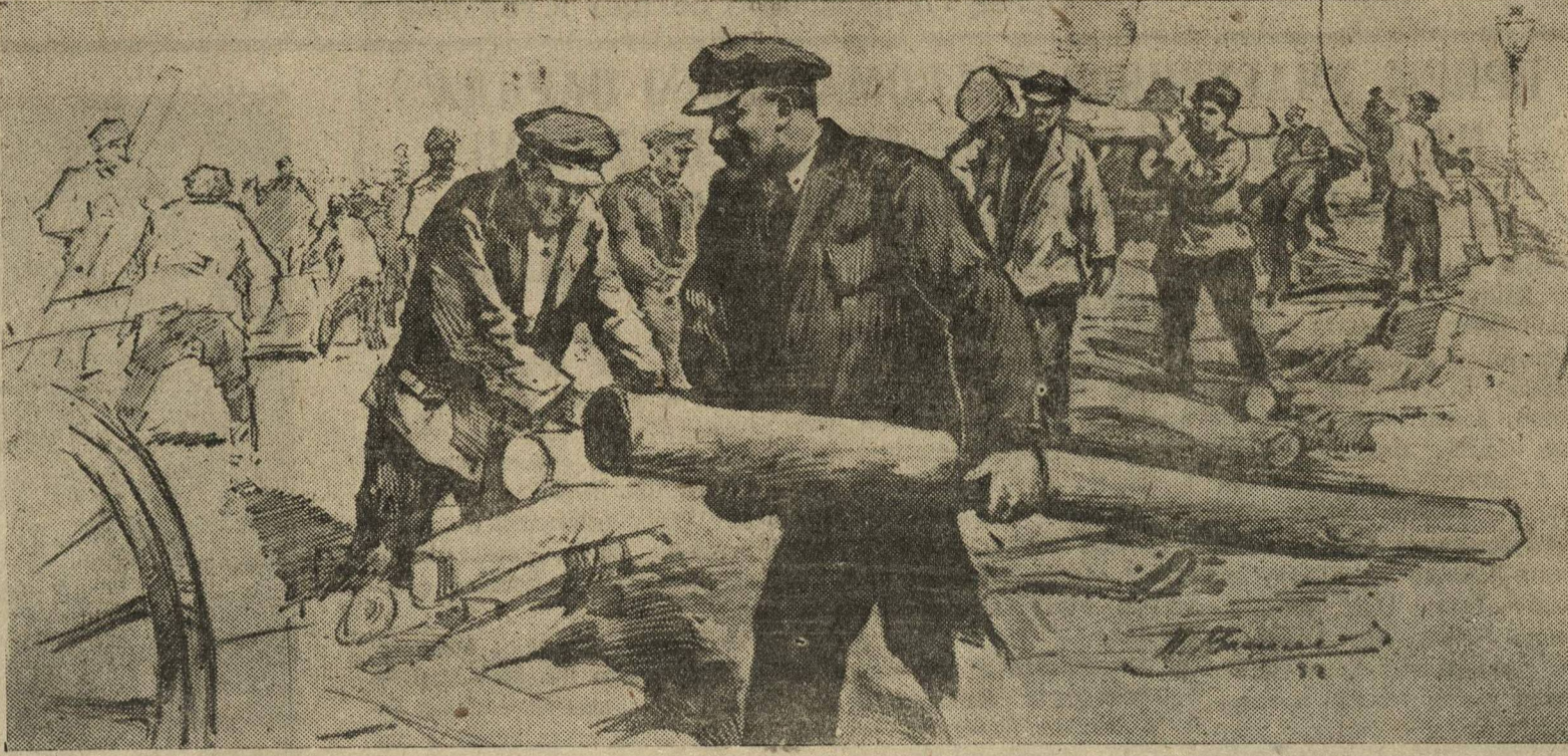
В. И. Ленин на Всероссийском субботнике в Кремле.