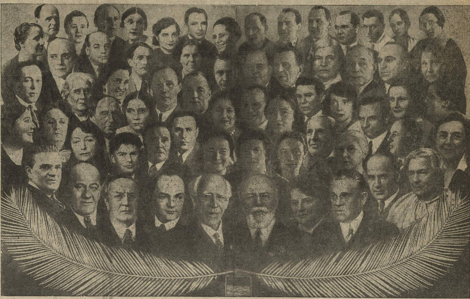
Основной состав труппы Московского Художественного театра (слева направо): 1-й ряд: нар. арт. СССР, орденосеца М. М. Тарханов; нар. арт. СССР, орденосеца Л. М. Леонидов; нар. арт. СССР, орденосеца В. И. Качалов; нар. арт. СССР, орденосеца Н. П. Хмелев; нар. арт. СССР, орденосеца К. С. Станиславский; нар. арт. СССР, орденосеца Вл. И. Немирович-Данченко; нар. арт. СССР, орденосеца А. К. Тарасова; нар. арт. СССР, орденосеца И. М. Москвин; нар. арт. СССР, орденосеца Б. Г. Добронравов; нар. арт. СССР, орденосеца О. Л. Книппер-Чехова, и другие.

И сегодня мы говорим дорогим гостям: добро пожаловать, товарищи! Город, носящий имя великого писателя, искренне рад приветствовать театр, на знамени которого также начертано это славное имя.