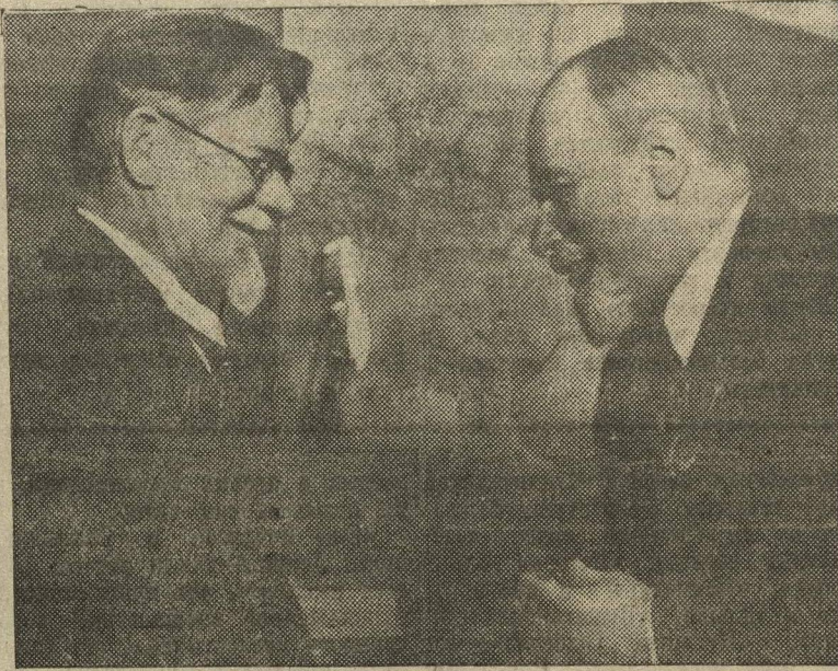
М. И. Калинин вручает орден Ленина народному артисту Союза ССР Вл. И. Немировичу-Данченко на заседании Президиума ЦИК СССР 7 мая 1937 года.

Народный артист Союза ССР Вл. И. НЕМИРОВИЧ-ДАНЧЕНКО.