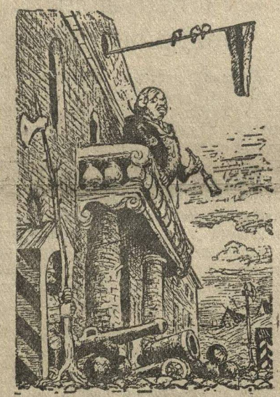
Глуковский губернский Васильев Семенович Бородавкин прославился тем, что спалил тридцать три деревни в борьбе против помещиков, возглавлял о заповедия в Глухово Адамиди, но, получив отказ, построил с/звизкий дом и мечтал о завоевании Византии. На этом рисунке Бородавкин изображен в тот момент, когда, сидя на балконе гродночического дома, взврал ступца, с полными с/звизками, на сиюнесиюе в/звизкие твердыни.