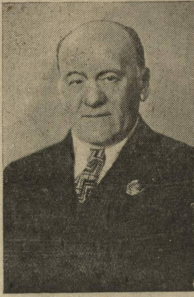
Народные артисты Союза ССР: В. И. Качалов в роли барона в пьесе «На дне», Л. М. Леонидов, М. М. Тарханов и И. М. Москвин в роли Луки («На дне»).

В своем сорокалетнем Художественный театр пришел обогащенный огромным опытом своего участия в строительстве социалистической культуры под знаменем партии Ленина — Сталина. Новое мирозерцание и органическая связь с передовыми идеями сталинской эпохи закалили его мужественное и правильное искусство. Творческая система Художественного театра, суммирующая сорокалетний путь его художественных исканий, стала в настоящее время господствующей системой театрального искусства нашей страны. Величайшим итогом сорокалетней деятельности театра является его живой коллектив, воспитавший блестящих мастеров советского театрального искусства. В этом коллективе представлены три поколения. «Старика» театра, участвовавшие в его организации и вынесшие на своих плечах его замечательное искусство (В. И. Немирович-Данченко, И. М. Москвин, В. И. Качалов, О. Д. Бланкер-Чехо-