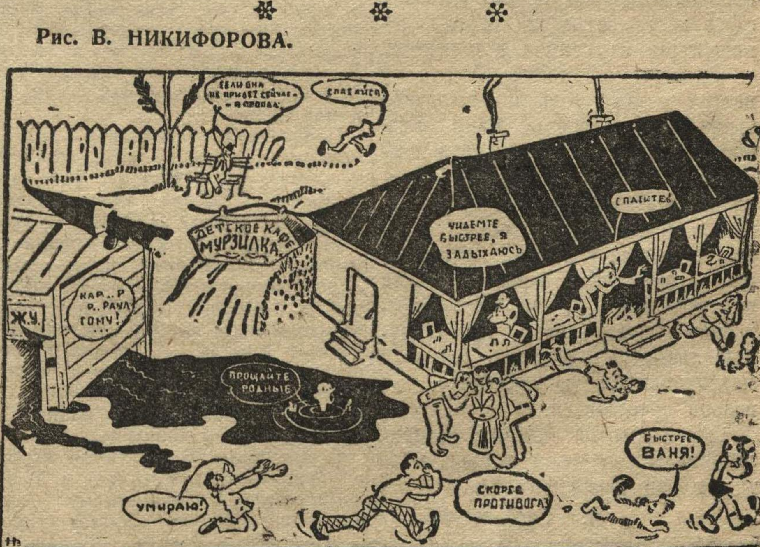
Рис. В. НИКИФОРОВА.

На углу Октябрьской и Свердловской улиц, в цветущем садике, только что открыто детское кафе «Музилка». В нескольких шагах от него находится гнилая, полуразвалившаяся уборная. До самой террасы кафе разливаются озера нечистот, распространяя зловонье.