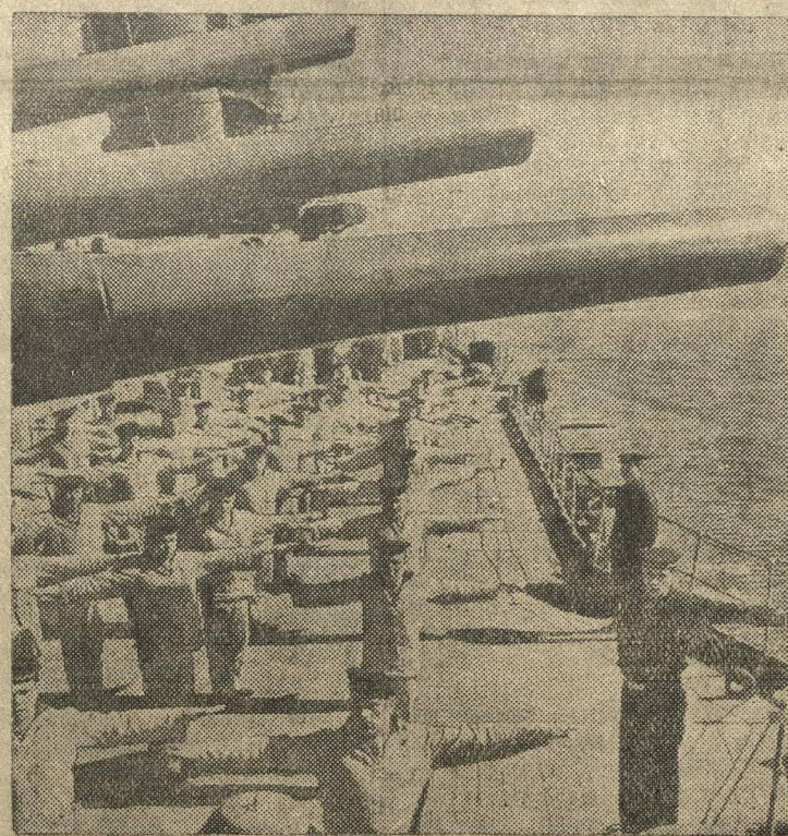
Физкультурная зарядка на линкоре «Октябрьская Революция».