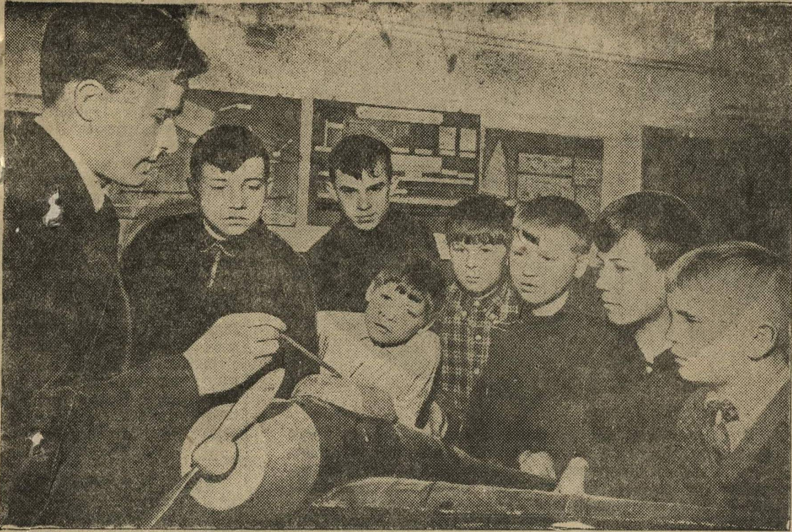
В Сормовской Детской Технической Станции. Группа ребят в аэробинаете знакомится с моделью самолета.