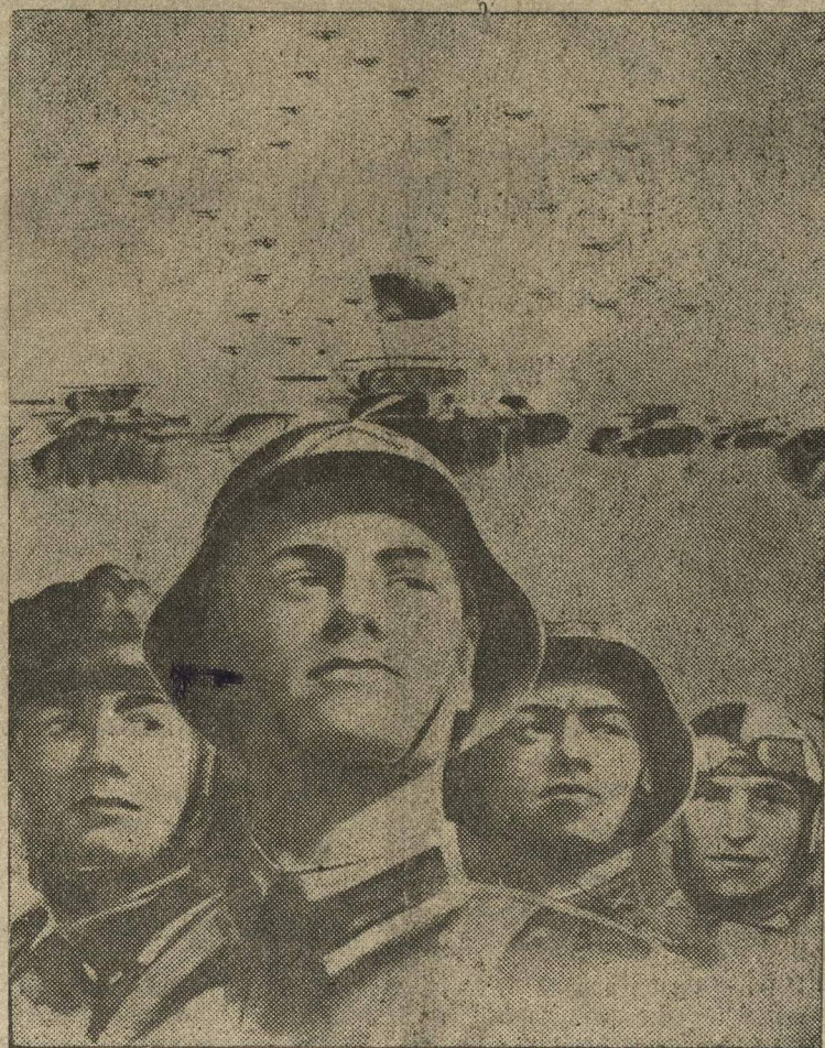
Воинская служба в Рабоче-Крестьянской Красной Армии предоставляет почетную обязанность граждан СССР. Плакат художника Глимашина, выпущенный издательством «Искусство».

Далим Рабоче-Крестьянской Красной Армии и Военно-Морскому Флоту физически здоровое, идеологически устойчивое и политически грамотное пополнение, овладевшее основами военной техники без отрыва от производства.