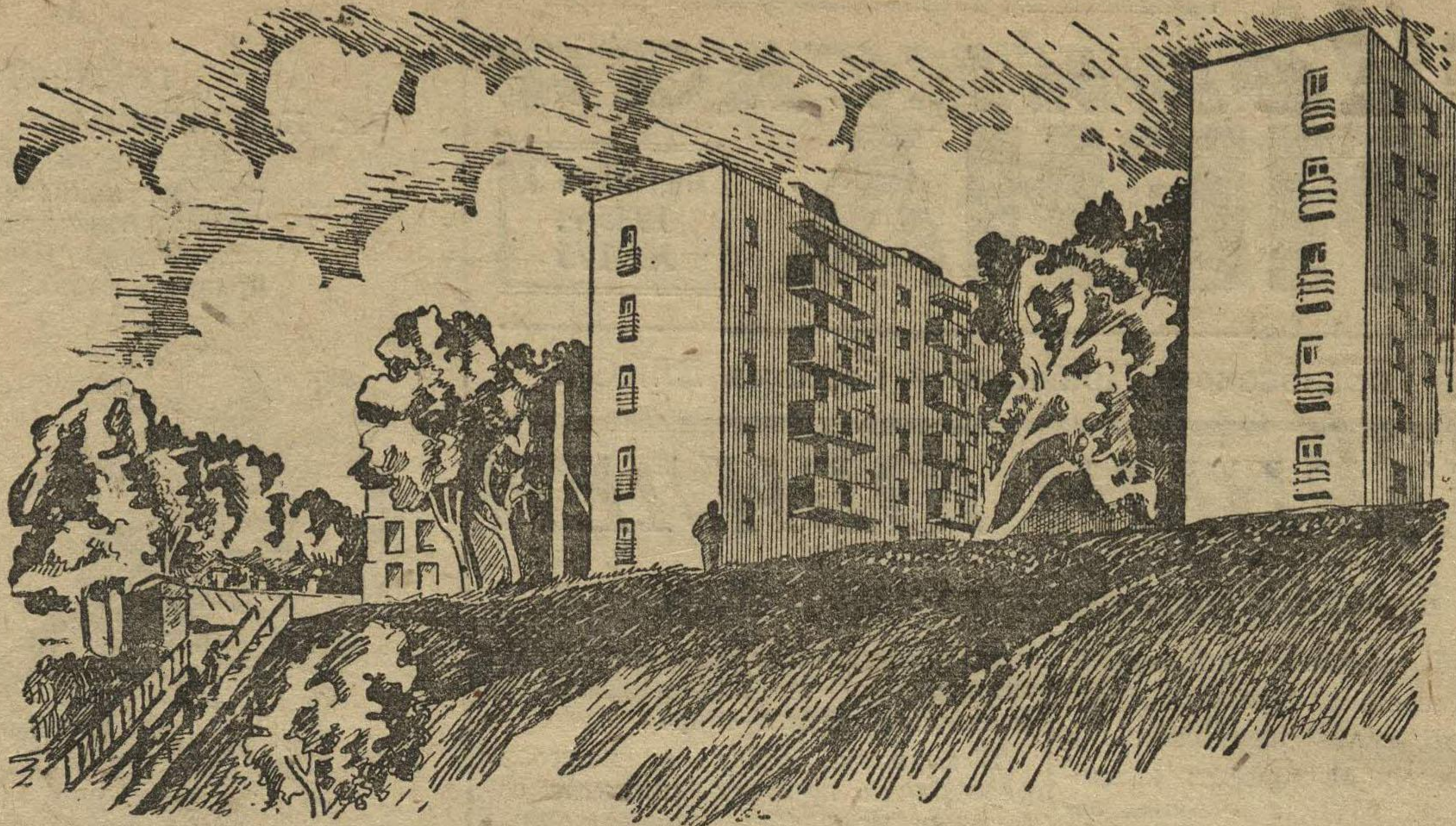
Дома Коммуны по улице МОПР, а (Свердловский район г. Горького).

Из такого положения для молодой девушки существует только один выход: идти по пути, по которому ее ведет комсомол, включиться в боевой фронт трудящихся, борющихся под руководством компартии за свержение прогнившей капиталистической системы, за установление советской власти в Чехословакии.