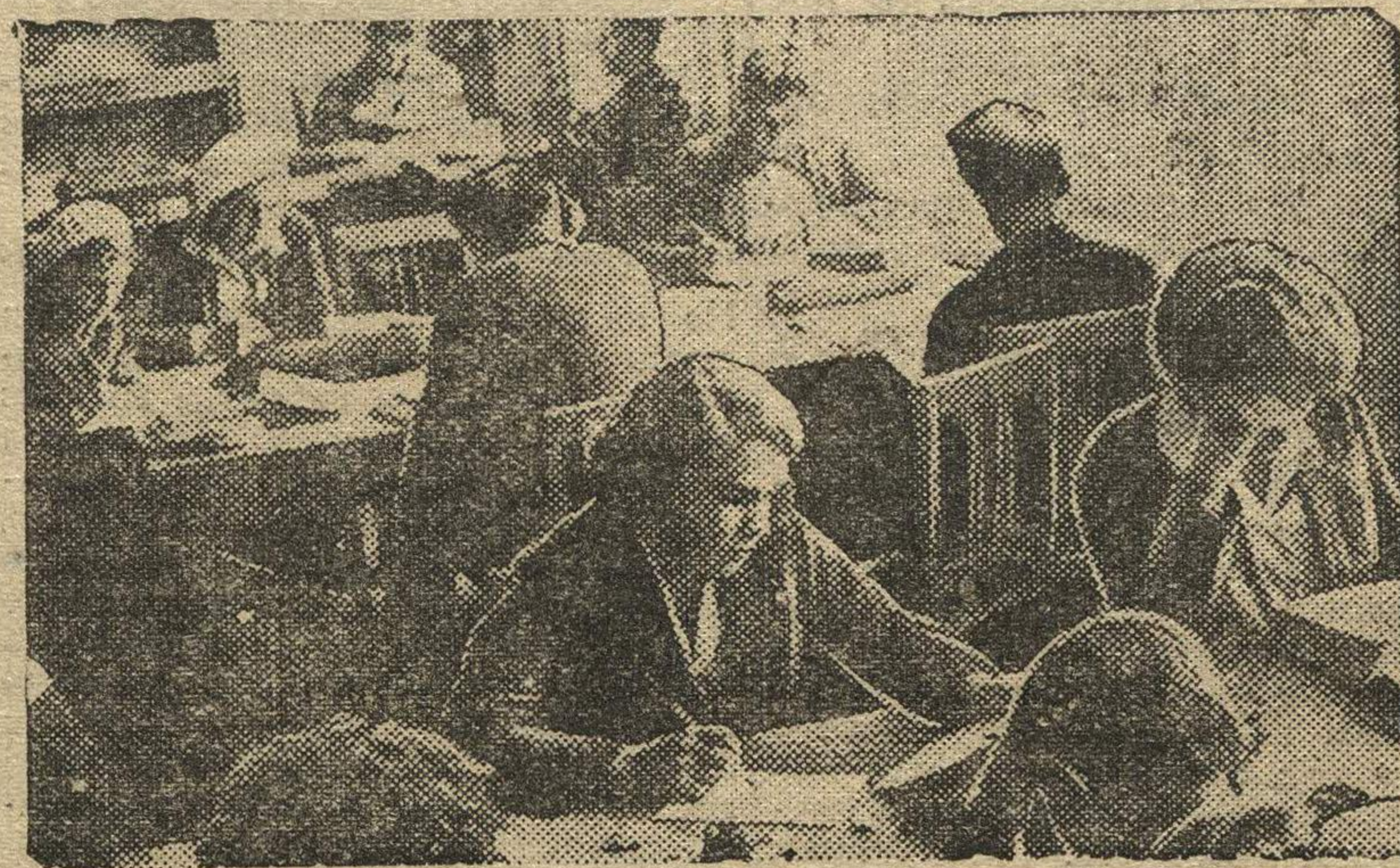
Библиотеку-читальню индустриального института ежедневно посещает около 250 студентов. Ежедневно выдается не менее 350 книг. На снимке: в читальном зале библиотеки.

Вчера в Киеве состоялся футбольный матч между сборной командой Украины и сборной Праги (Чехословакия). Матч закончился со счетом 1:0 в пользу Праги.