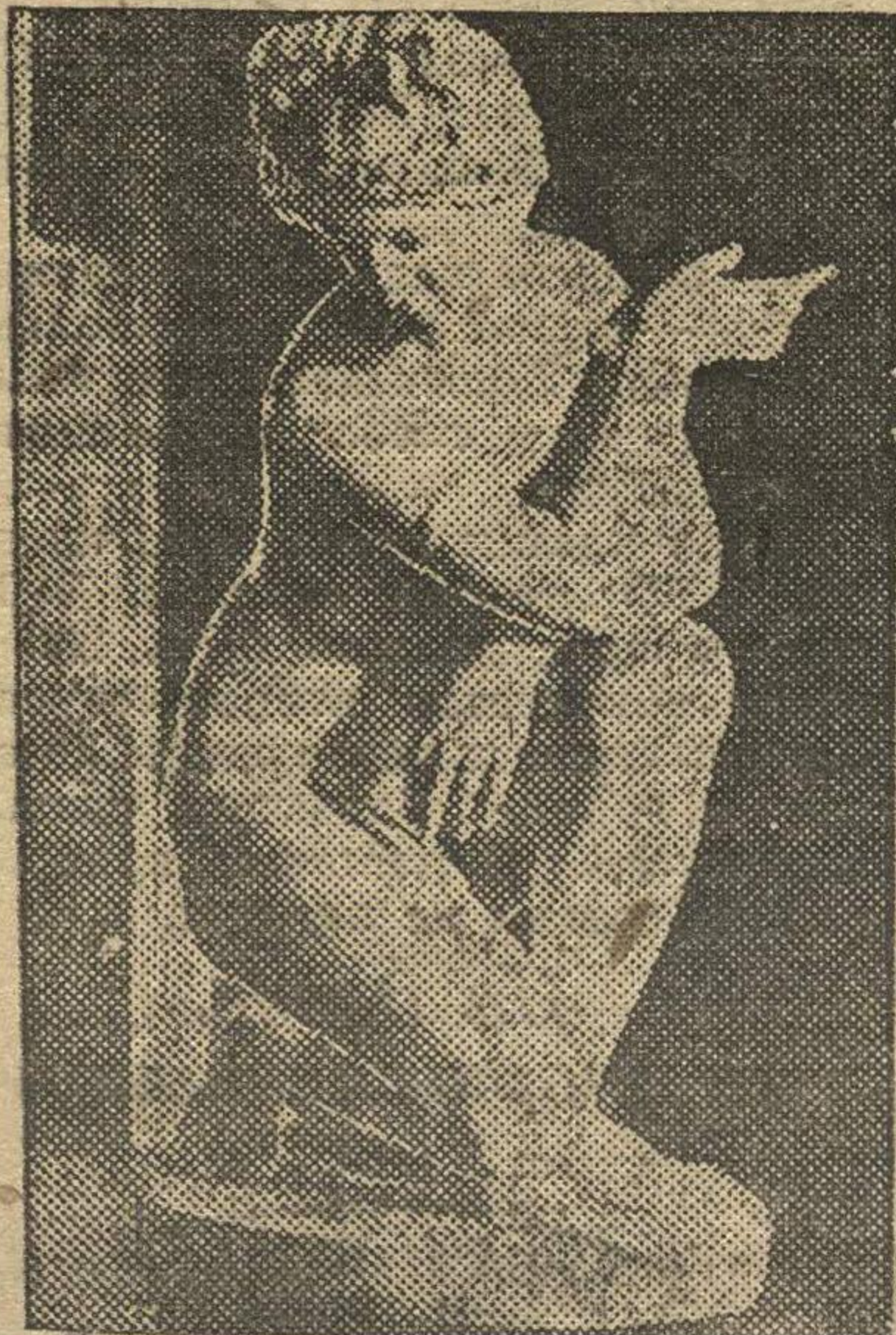
Скульптура при входе в Горьковский Художественный музей.