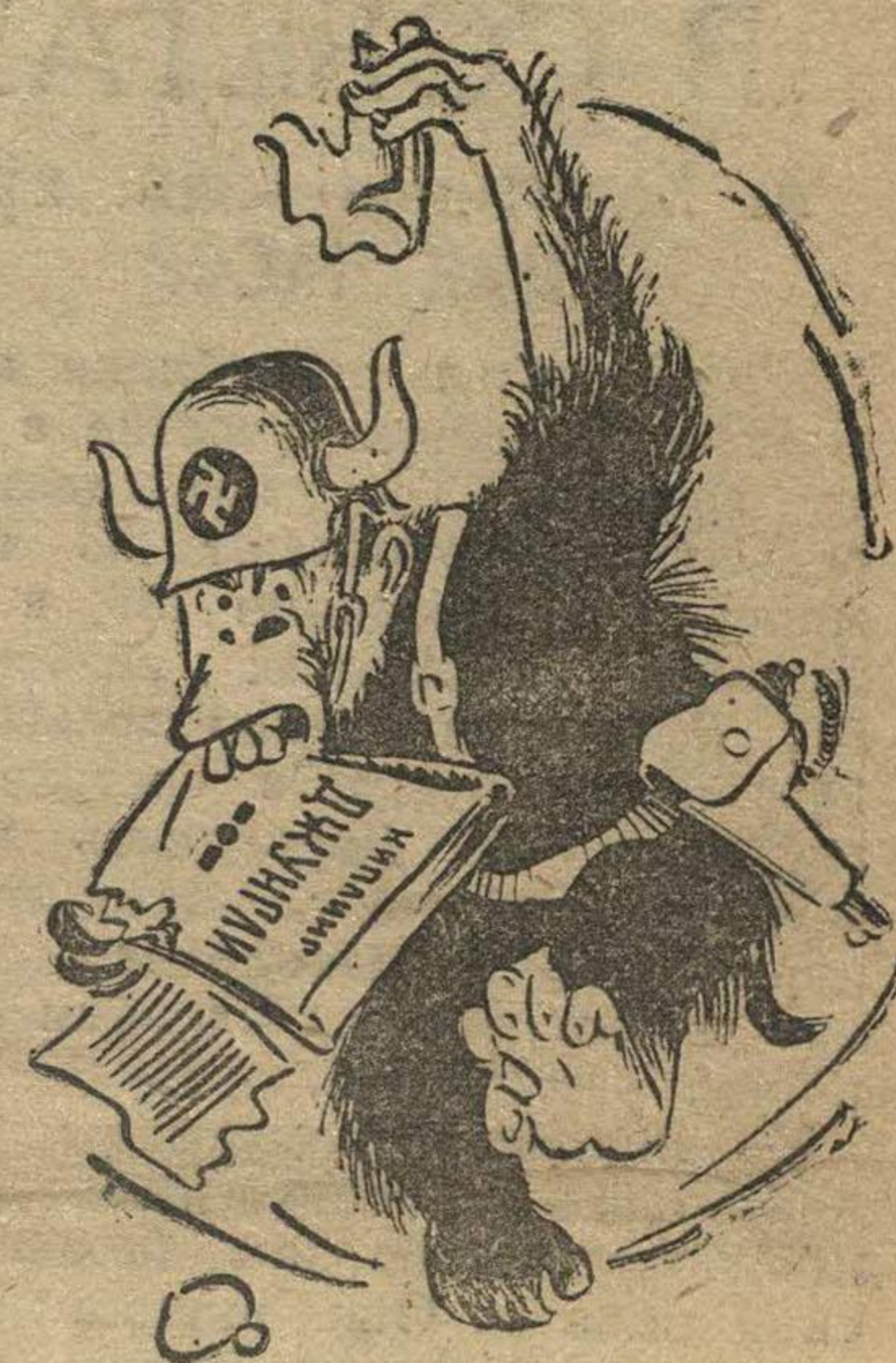
— «Пр-р-рошу не намекаль!»