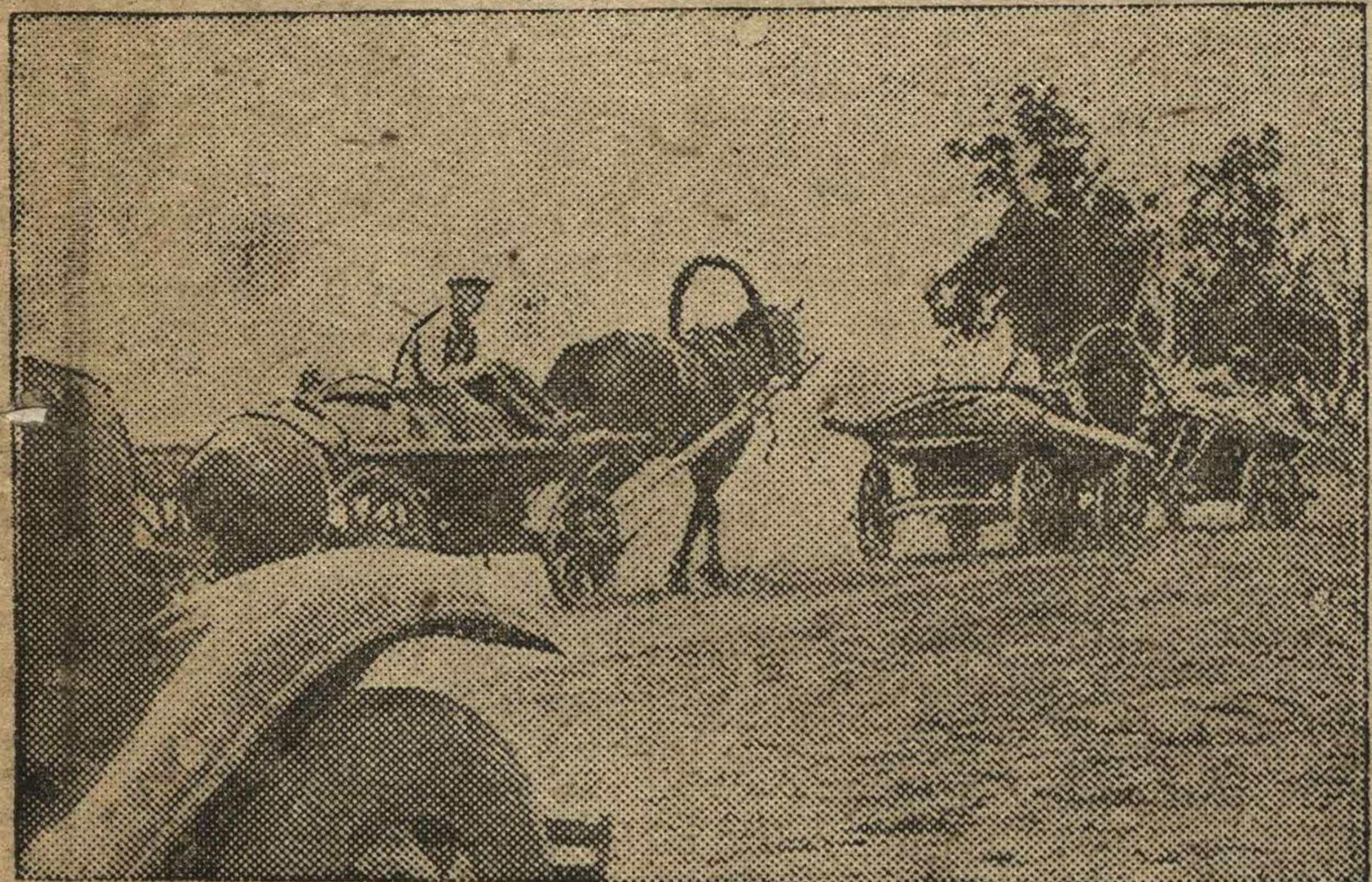
На машинах и на лошадях везут хлеб для сдачи государству. На снимке: колхозники Сергачского района, колхоза им. Сталина, едут сдавать хлеб.