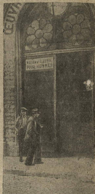
Безработные Брюсселя (Бельгия) у ночлежного дома.