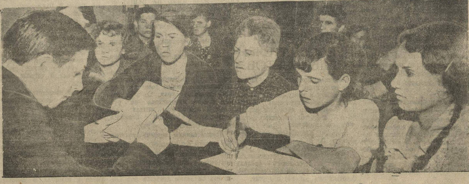
На занятиях комсомольского кружка политграммоты при горьковской фабрике «Красный обувщик». Слева — руководитель кружка, Фото П. Вознесенского.

Надо, чтобы Куйбышевский райком конкретно руководил и помогал комсомольским организациям. Тогда пропагандистская работа намного улучшится. Е. КАСАТНИНА, зам. секретаря комитета ВЛКСМ.