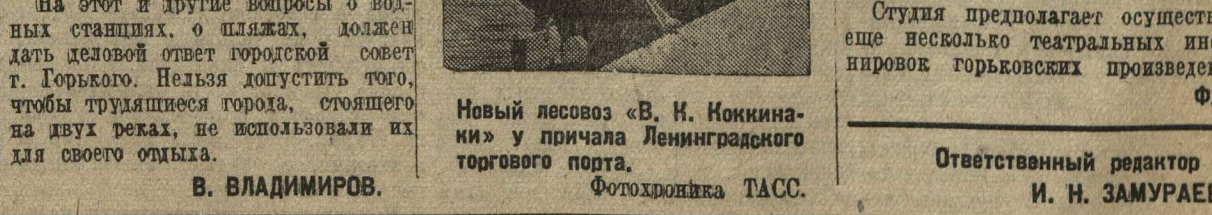
Новый лесовоз «В. И. Ноккина» у причала Ленинградского торгового порта.