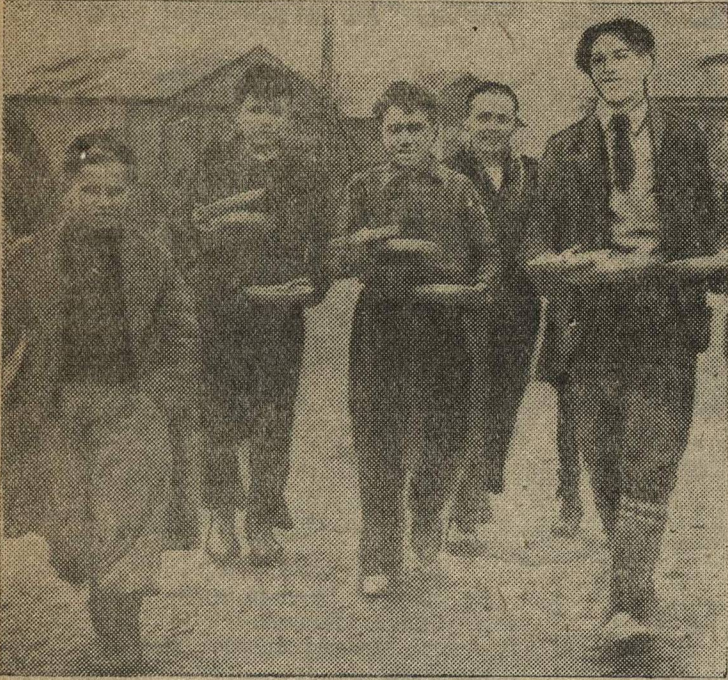
В бараках, лишенные самых примитивных удобств, живут во Франции испанские беженцы. На снимке: дети-беженцы несут малкий обед.