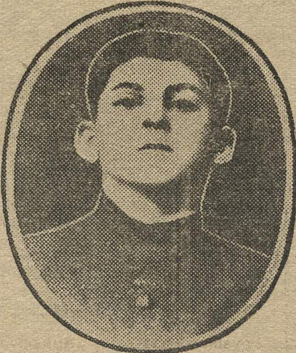
И. Сталин 8 лет.

Полная таинственность и стук прессы в доме старика навели соседних крестьян на мысль, что