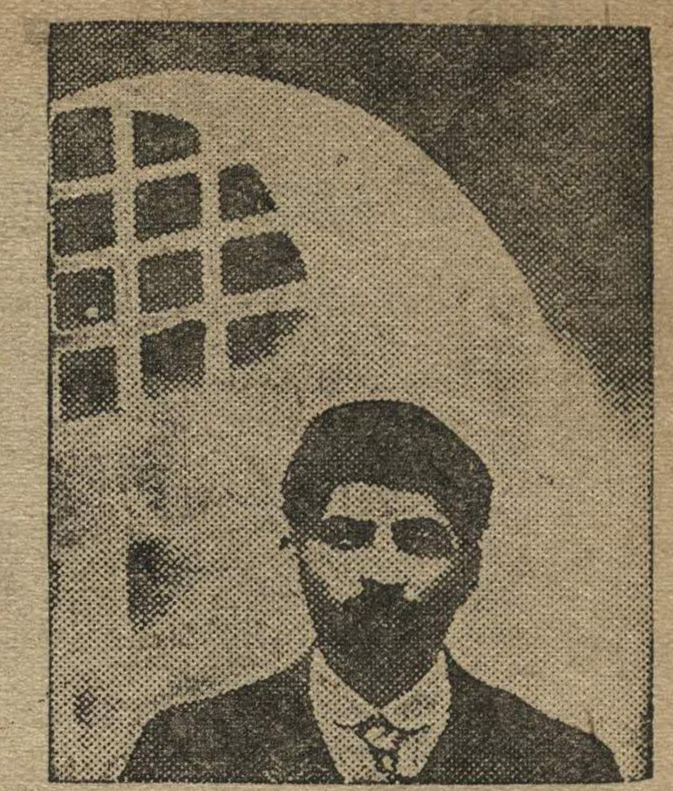
И. В. Сталин (тюремный снимок).

Находясь в Сибири, в низменной местности, ему случилось попасть в одну из тех ужасных ледяных бурь, которые там называют «пургой». Против пурги есть только одно средство — лечь и закопаться в снег. Вместо того, чтобы это сделать, Коба продолжал идти своей дорогой. Он шел по замерзшей реке. Ему понадобились целые часы, чтобы пройти три километра, отделявшие его от ближайшей хижины. Когда он ее наконец достиг и переступил через порог, его приняли за призрак: он обледенел с головы до ног. Когда лед оттаял, Коба упал и проспал 18 часов без перерыва. После этой истории туберкулез исчез навеки. Так обычно и бывает: если Сибирь не убивает туберкулезного, то она его радикально излечивает.