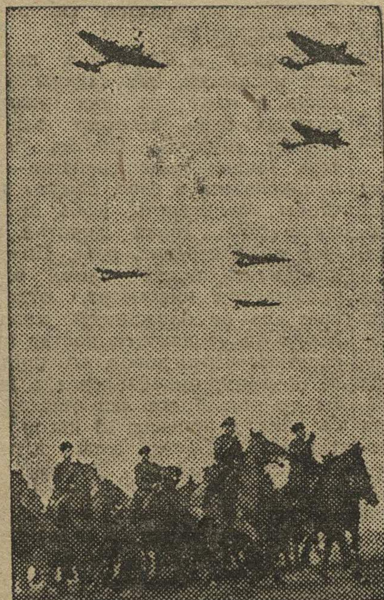
Военные самолеты и тачанки. (Снимок сделан на учениях Киевского военного округа).

ИЗВЕЩЕНИЕ 29 сентября 1935 г. в 6 часов вечера в помещении детского клуба им. Жданова (площадь Свободы) назначается собрание Свердловского районного комсомольского актива с вопросом о проработке речи тов. Ленина на III съезде комсомола.