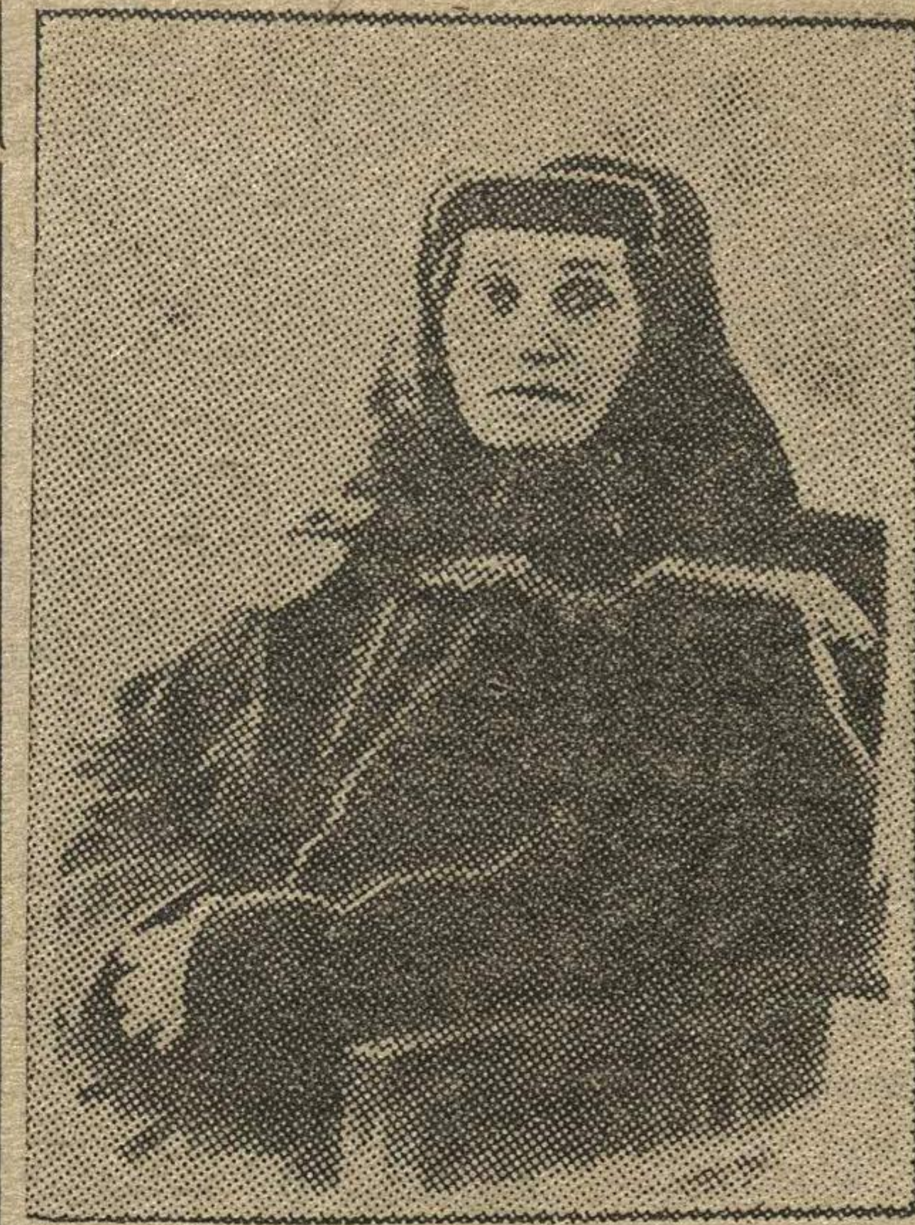
Мать И. В. Сталина, — Екатерина Джугашвили.

Несмотря на все это, или вернее благодаря этому, семинария была «очагом новых идей». Эти