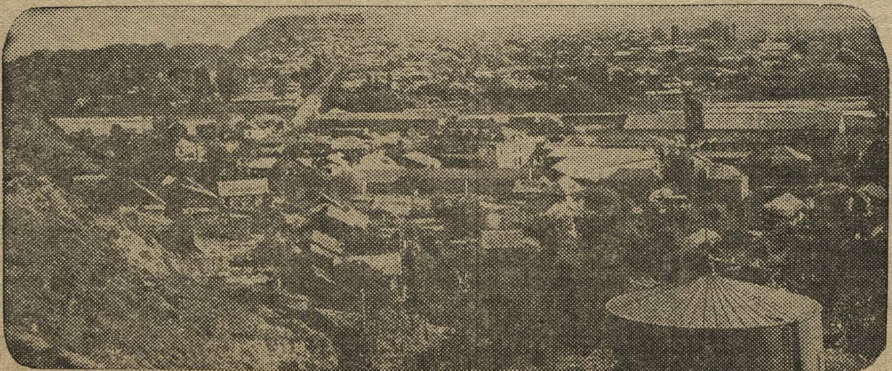
Город Гори (ЗСФСР), где родился И. В. ДЖУГАШВИЛИ — СТАЛИН.