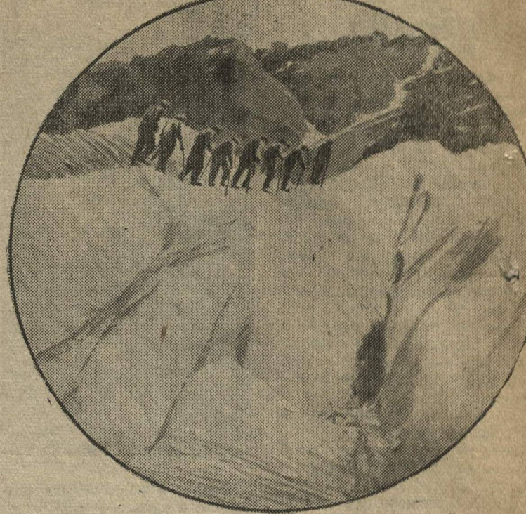
На высоте двух тысяч метров над уровнем моря, в живописной местности Северной Осетии, расположен курорт «Цей», построенный за годы сталинских пятилеток. Чистый горный воздух, богатейшая растительность привлекает сюда трудящихся со всех концов Советского Союза. (Вблизи курорта раскинулись лагеря альпинистов, туристов, пионеров и спортсменов «Буревестник» и «Торпедо»). На снимке: группа молодежи из Донбасса в Цейском леснике на практических занятиях по альпинизму.