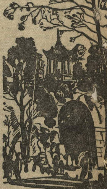
Беседка «Наприз» в окрестностях Ленинграда.