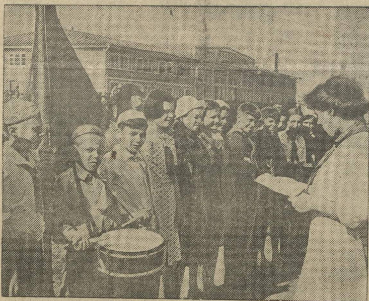
Дети рабочих и служащих Верхне-Волжского пароходства выезжают в пионерские лагеря в Васильевске. На снимке: перекличка пионеров перед посадкой на пароход.

Областной выставочный комитет посылку экспонатов двадцати колхозов.