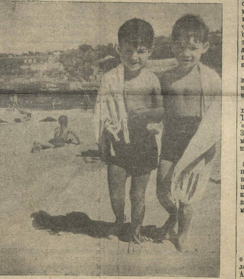
Юные купающиеся.