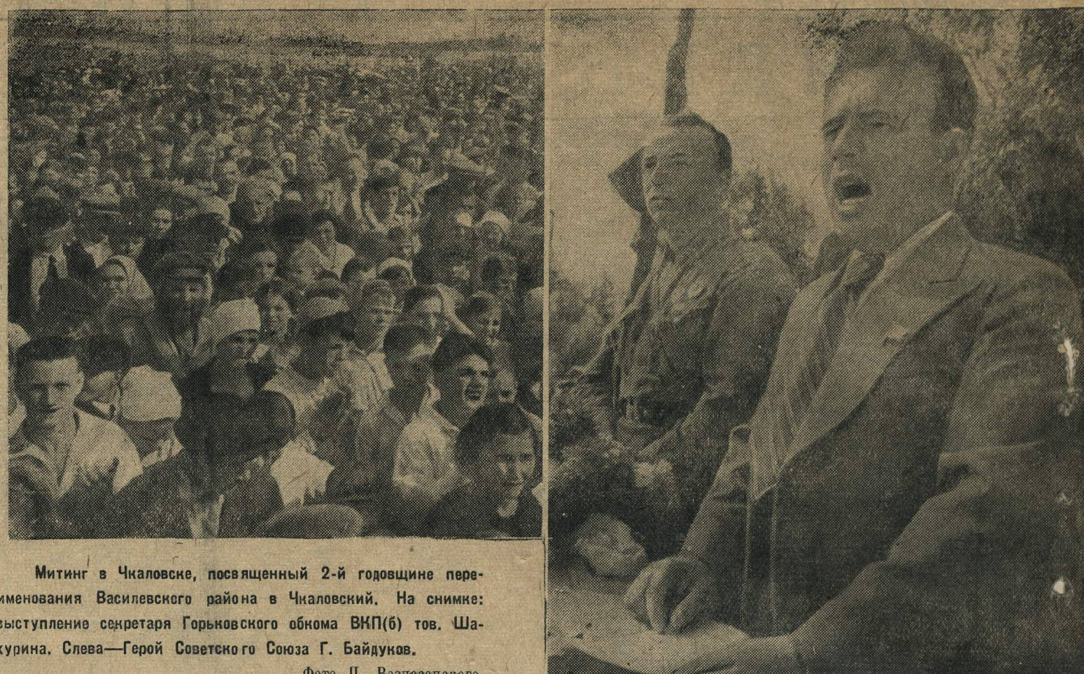
Митинг в Чкаловске, посвященный 2-й годовщине переименования Василевского района в Чкаловский. На снимке: выступление секретаря Горьковского обкома ВКП(б) тов. Шахурин. Слева—Герой Советского Союза Г. Байдуков.

В Японии образовано новое правительство. Премьер-министром и министром иностранных дел назначен генерал Абэ Нобуюки.