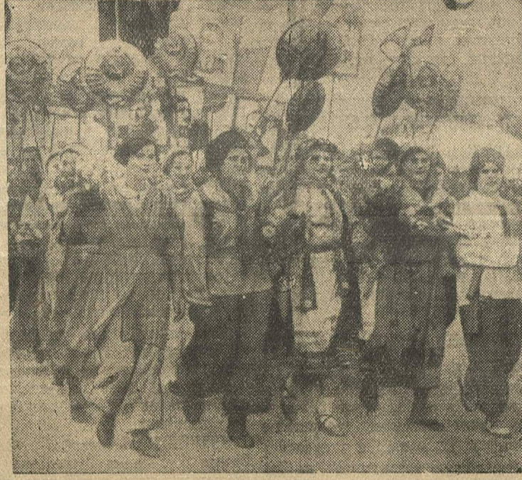
Международный юношеский день в г. Горьком. В колонне молодежи Куйбышевского района.