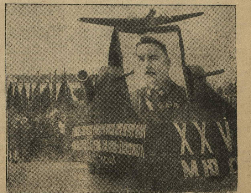
Международный юношеский день в г. Горьком. Головная колонна Ворошиловского района вступает на площадь 1 Мая.

ЧЕБОКСАРЫ. Герой гражданской войны В. И. Чапаев родился и рос в дер. Будаевке, Усадского сельсовета, Чебоксарского района. Здесь, на родине Чапаева, 5 сентября состоялся большой митинг, посвященный 20-летию со дня гибели легендарного начдива. С воспоминаниями выступил земляк В. И. Чапаева.