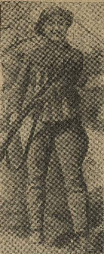
Китайская девушка, добровольно вступившая в армию.

Польское правительство и польские телеграфные агентства выехали из Варшавы в Люблин.