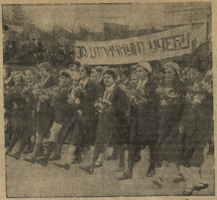
Международный юношеский день в г. Горьком. Колонна учащихся Ждановского района.