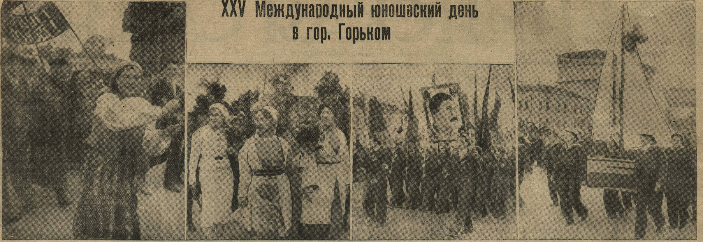
Демонстрация молодежи. На снимках (слева направо): 1. С песнями, плясками проходит молодежь перед трибуной. 2. Колонна Дворца пионеров. 3 и 4—в колоннах Ждановского района.