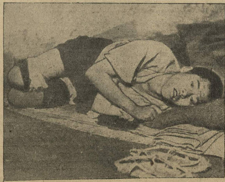
Японская авиация продолжает свои варварские налеты на мирные города Китая, убивая и нанося ранения женщинам, детям и старикам. НА СНИМКЕ: юнга, раненый во время бомбардировки.

Как сообщают, французские войска начали военные действия у подножья Вогезов. Как германские, так и французские инженеры вечером 9 и 10 сентября заложили динамит в угольные шахты, расположенные вдоль реки Саар, на случай внезапных атак противника.