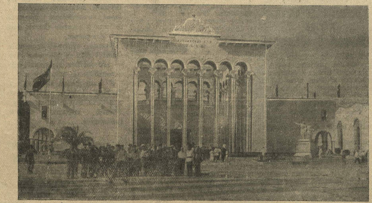
Всесоюзная сельскохозяйственная выставка. Павильон Грузинской ССР.

стихией, то новый человек в деревне социалистической, вооруженный современной агрономической наукой, передовой машинной техникой, объявив войну стихии и нашел пути, ведущие к победе. На XVII съезде партии И. В. Сталин указал на средства борьбы с засухой и суховеями. Это — засаждение лесозащитных полос в восточных районах Зауралья и орошение. Вот перед нами макет Буйбышевского гидроузла Большой Волги в павильоне Поволжья. Большая Волга — это уже не проблема. Это практическая задача, которую мы решаем сейчас. Человек получает мощное оружие для борьбы с засухой. Большая рельефная карта раскрывает перед нами грандиозный стратегический план наступления на стихию. Извивается могучая река. Перегороденная плотинами, она местами то разливается широкими морями, то распадается на небольшие реки, ручьи, охватывающие огромные массивы. И тут же сирвака: орошение Зауралья во много раз увеличит посевные площади, в пять—шесть раз поднимет урожайность полей, позволит увеличить поголовье крупного рогатого скота в 3—5 раз, свиней в 12—15 раз, овец в 8—10 раз. И в борьбе с засухой, как и в водое, есть свои зачатки, передовики, инициаторы, которые практически и теоретически решают