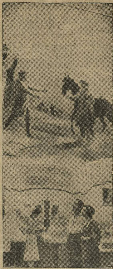
Всесоюзная сельскохозяйственная выставка. У павильона «Встреча аэрына Днамбула» в павильоне Казахской ССР.