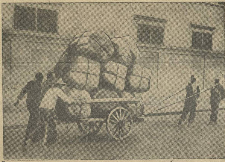
Условия труда китайских рабочих в оккупированных Японией районах наиболее тяжелые в мире. Окупанты не применяют современной механики, предпочитают выезжать на спине китайского рабочего в возке груза на улице Ханькоу. (Фотогалаше ТАСС).

БЕРЛИН, 14 сентября (ТАСС). Официально сообщается, что сегодня в 10 часов 15 минут германские войска вступили в Гдыню. Севернее Гдыни продолжаются бои.