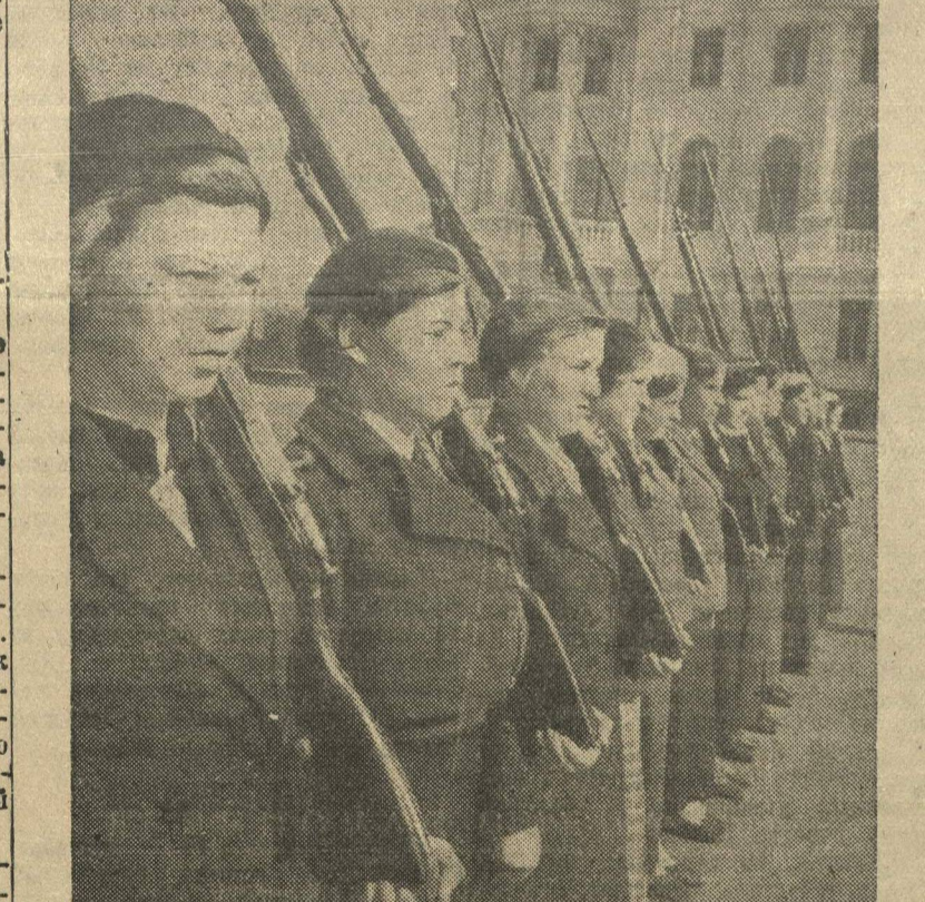
Студентки II курса Горьковского государственного университета на военных занятиях.

Новый спортивно-тренировочный самолет с автомобильным мотором — блестящая победа советского легкого самолетостроения.