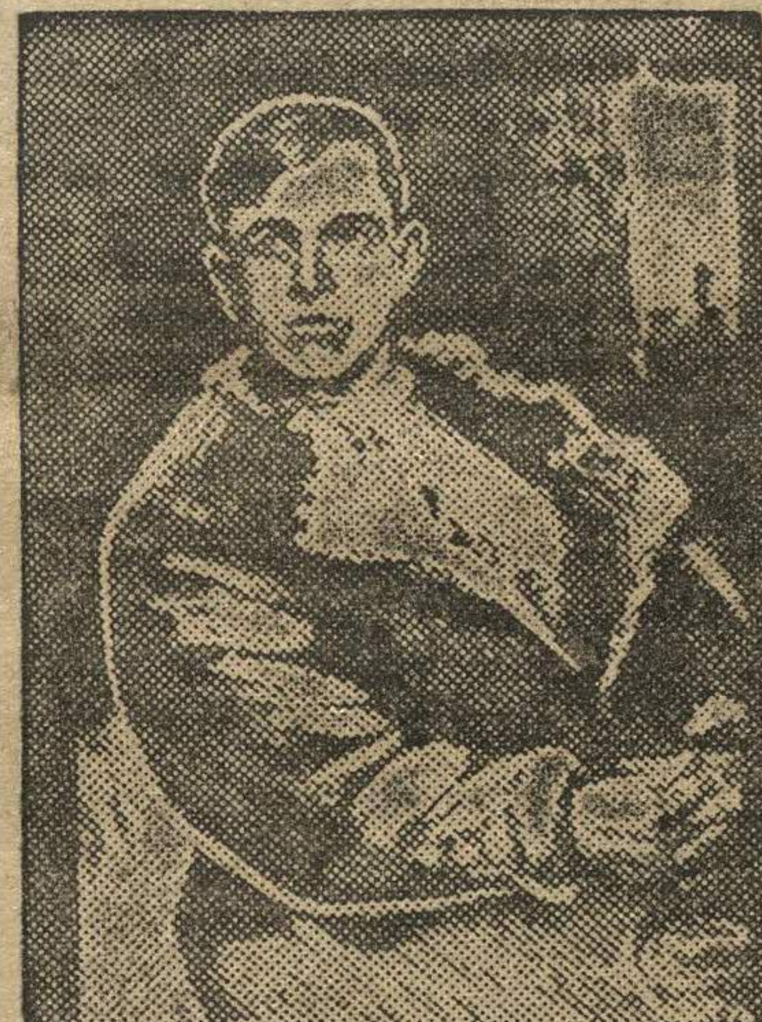
«РАБОК» — картина художника В. Ф. Константинова. (Дзержинский район).

6. В декабре месяце заслушать доклад горкома, Сормовского и Свердловского райкомов ВЛКСМ о выполнении настоящего решения.