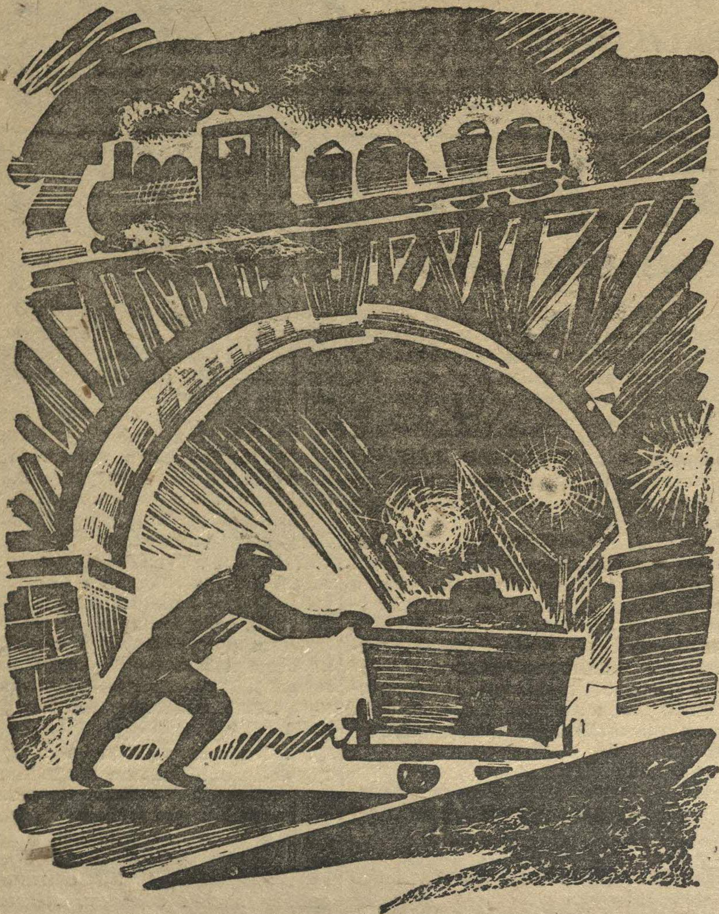
Рис. И. ЛОНДОН.