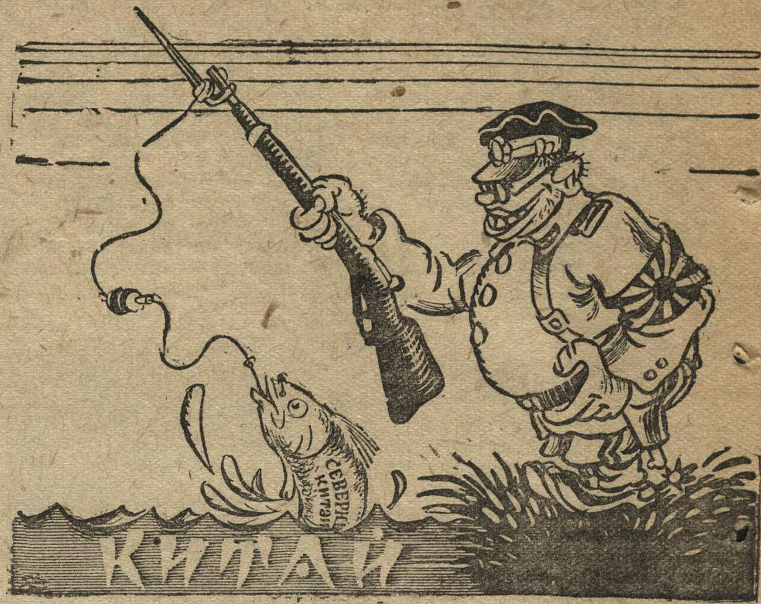
Рис. Н. ГОЛОВИНА.