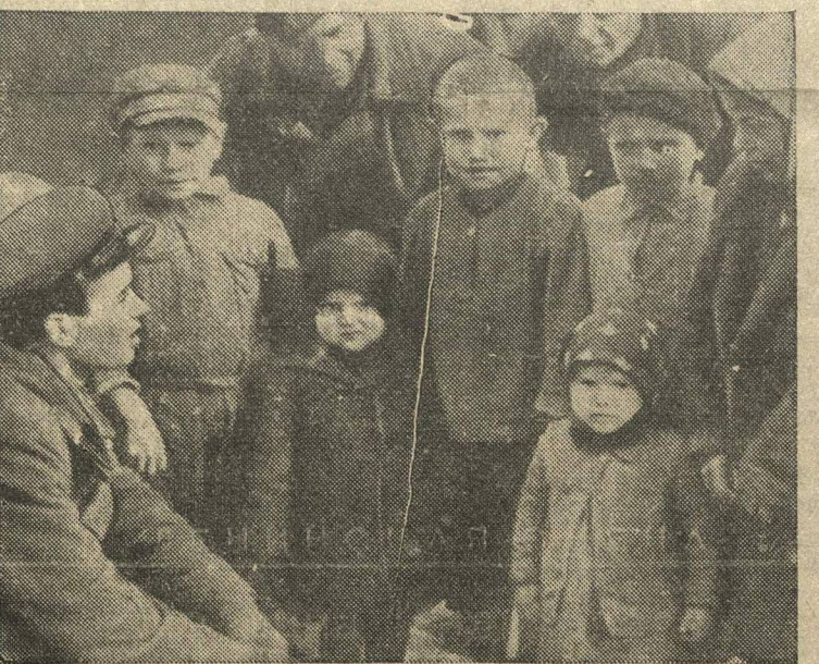
По городам и селам Западной Белоруссии. На снимке: команди Красной армии беседует с группой крестьянских детей (Виленская округа).

стями и распределяется с молотка. Одновременно сообщается, что французские профсоюзы исключили коммунистов из состава правлений профсоюзов.