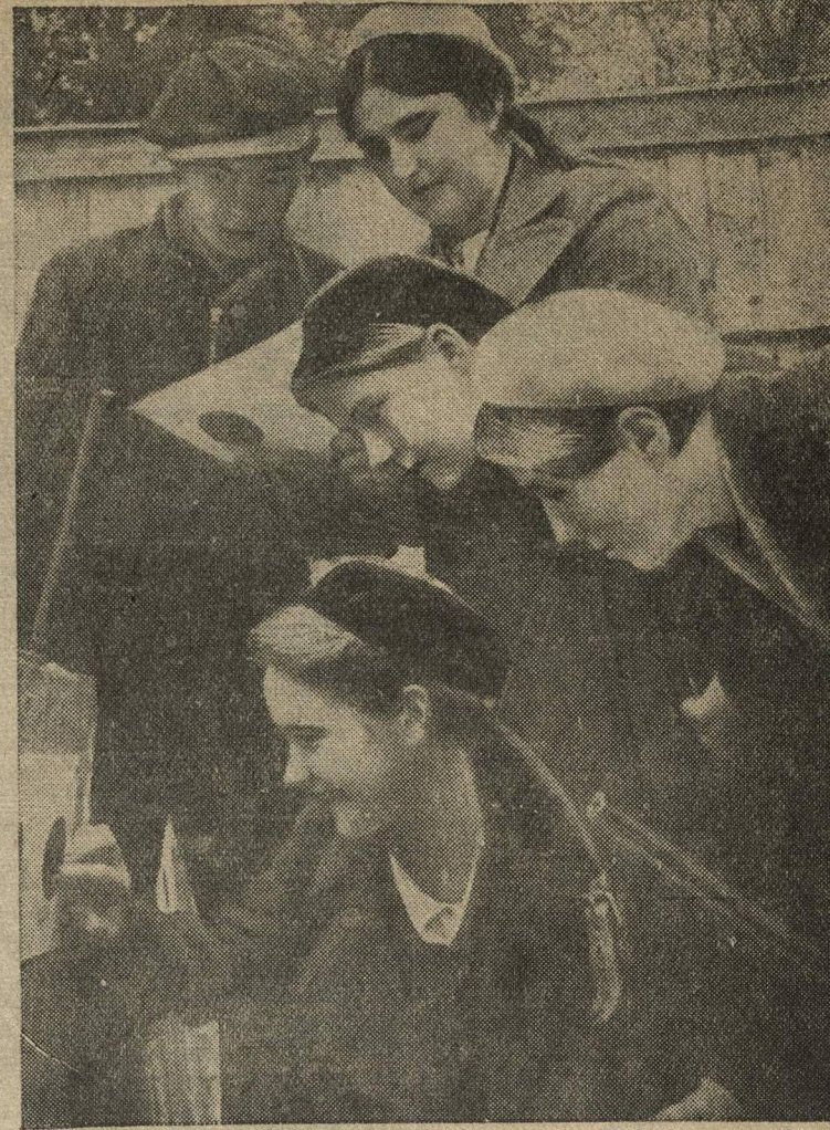
Группа учеников 10 класса школы № 18 г. Горького в тире после учебной стрельбы рассматривает мишени.