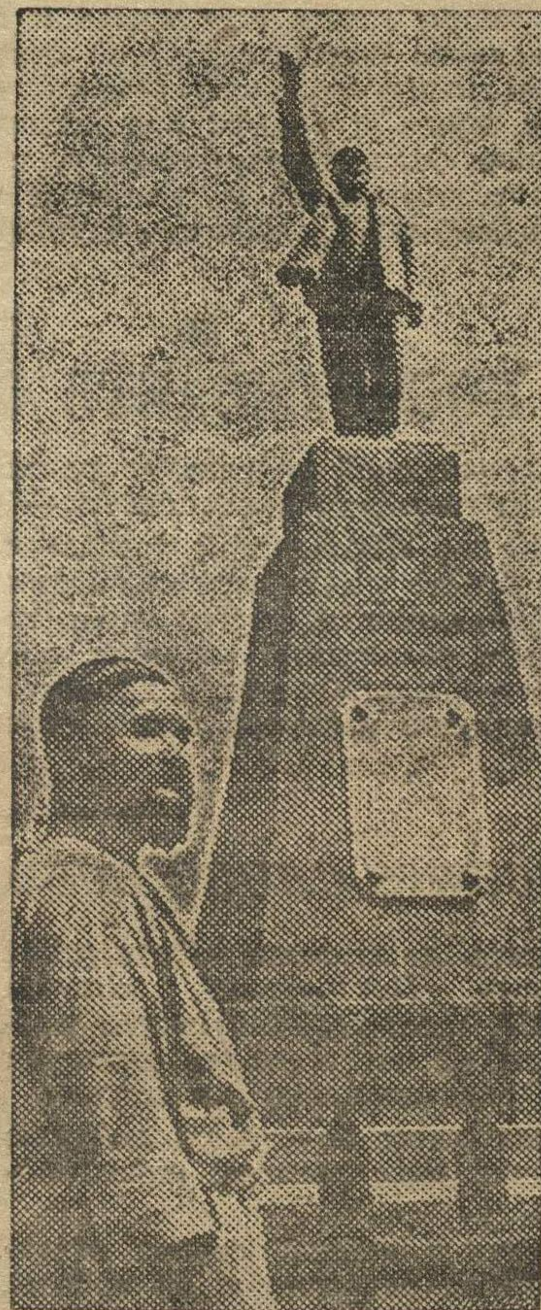
Памятник Ленину в городе КАГАН (6. Новая Бухара, Узбекской ССР).