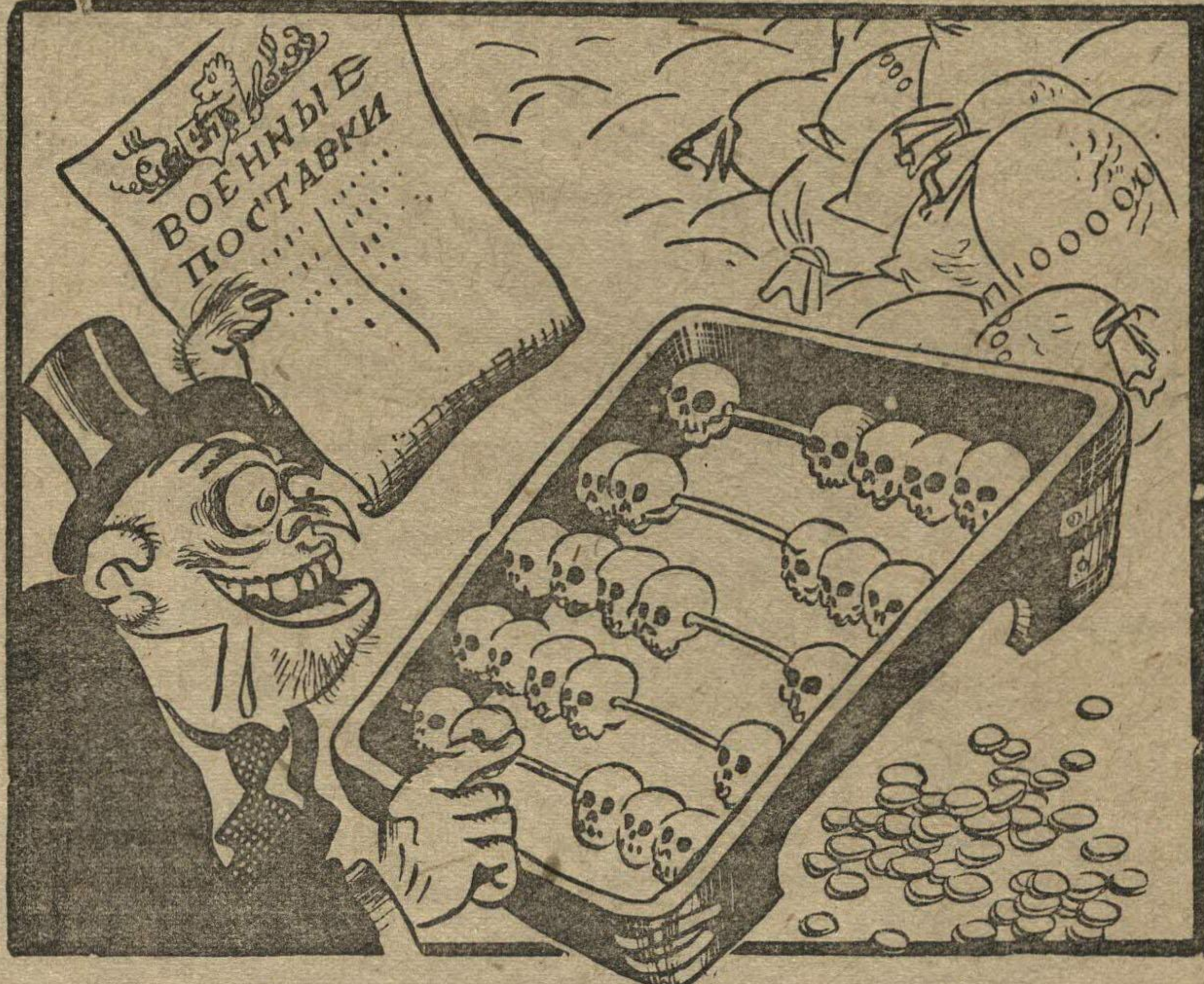
Рис. Н. ГОЛОВИНА.