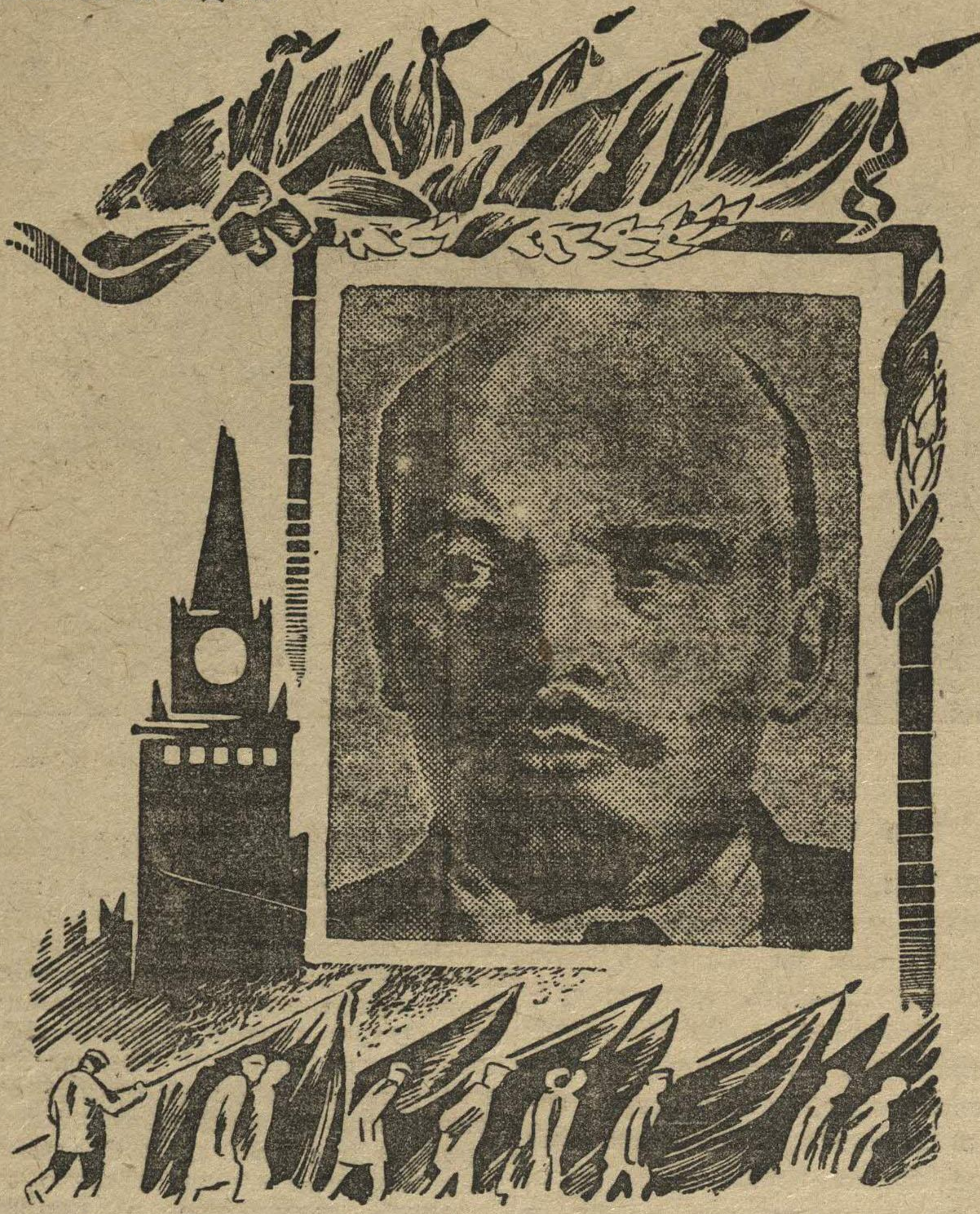
Рис. И. ЛОНДОН.