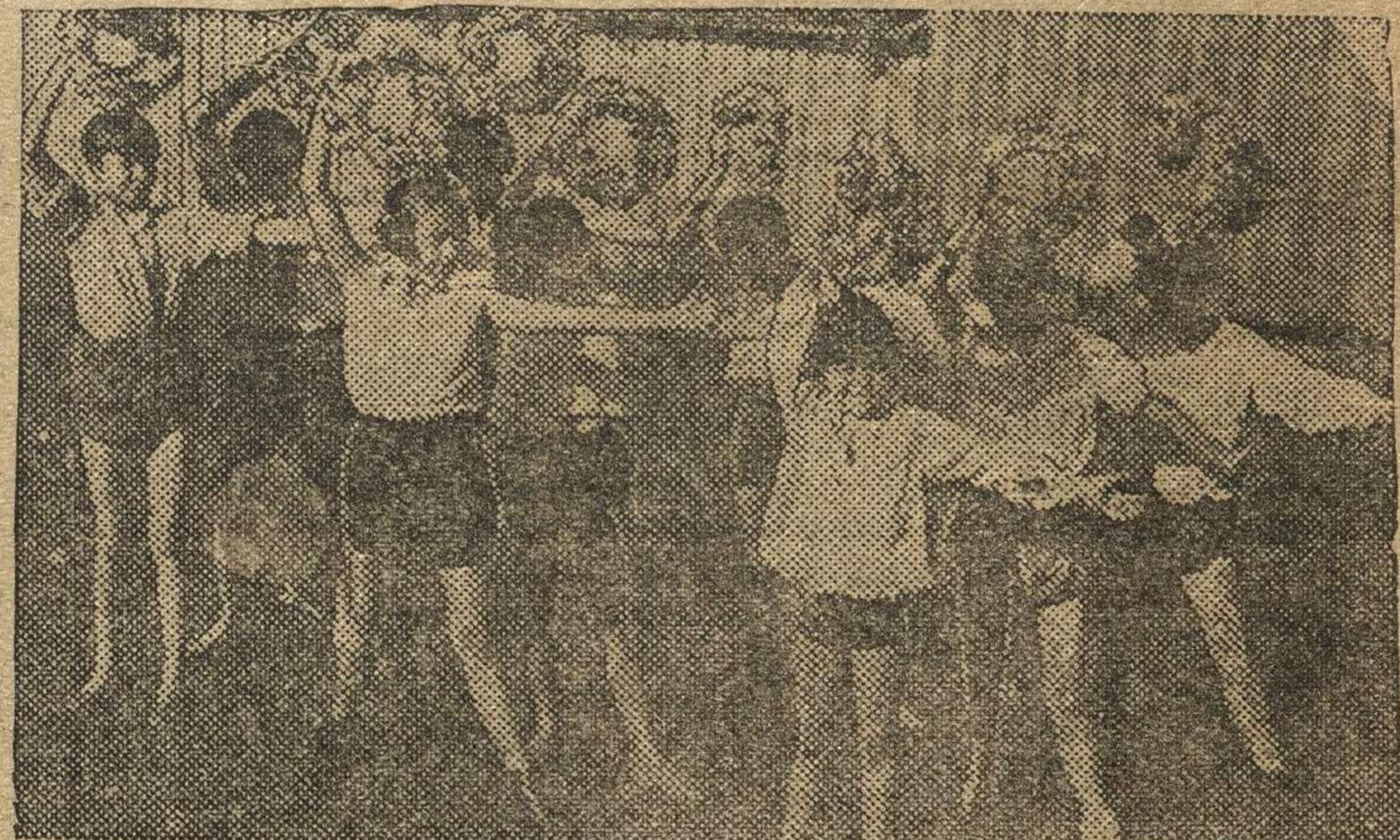
Школы готовятся к празднованию Октябрьской годовщины. НА СНИМКЕ: разучивание танца с цветами в школе им. Шевченко.