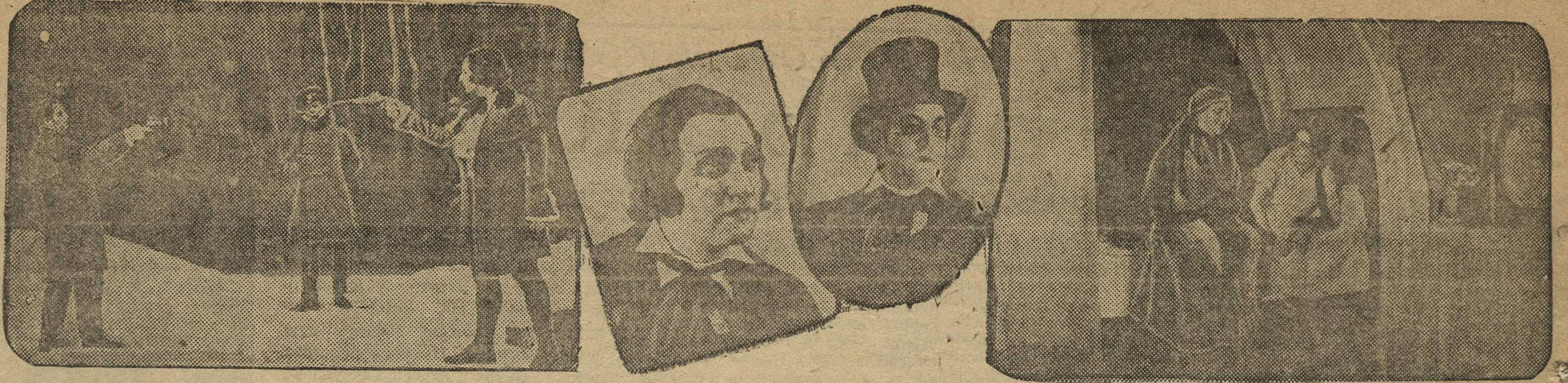
«ЕВГЕНИЙ ОНЕГИН» НА СЦЕНЕ ТЕАТРА ОПЕРЫ И БАЛЕТА.

26 октября состоялась премьера оперы «Евгений Онегин». На снимках: 1. Сцена дуэли Ленского с Онегиным; 2. Ленский (арт. Раушев); 3. Евгений Онегин (арт. Соломяк); 4. Сцена в спальне Татьяны (Татьяна — арт. Казанская и няня — арт. Барская).