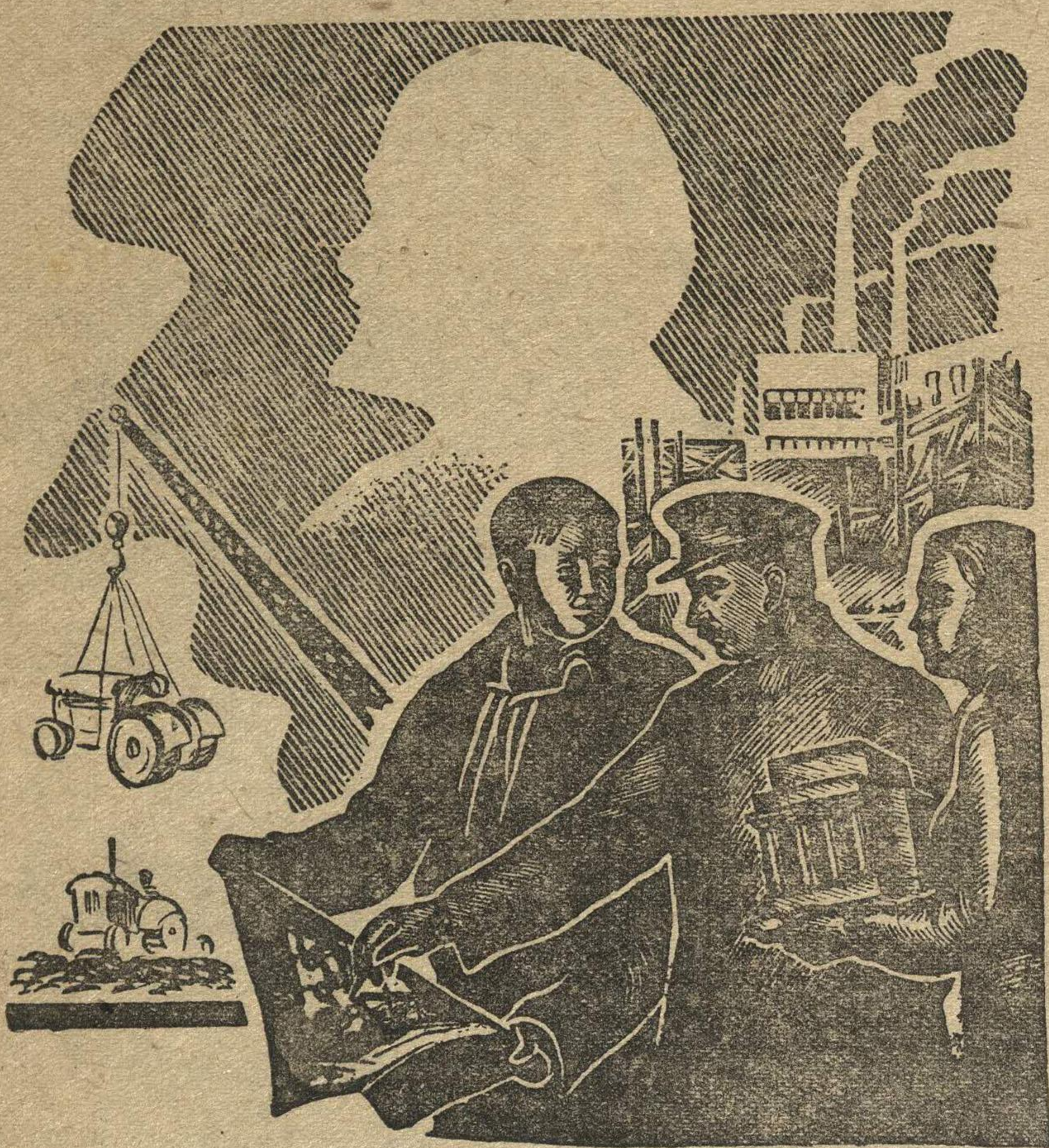
Рис. И. ЛОНДОН.