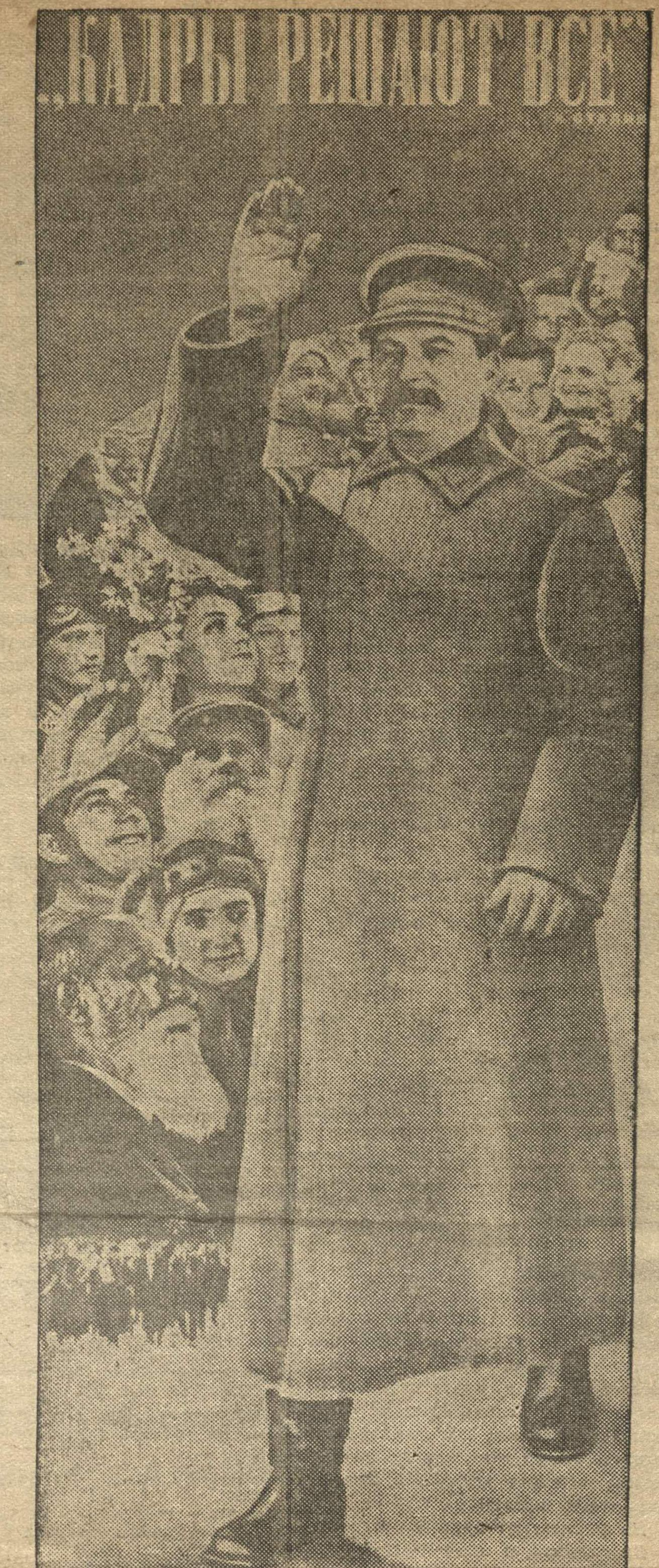
«КАДРЫ РЕШАЮТ ВСЕ» плакат работы художника КЛУЧИСА, выпущенный ОГИЗ'ом к октябрьским дням.

Чтобы не оказаться в смешном и глупом положении, чтобы не очутиться во главе небольшого круга людей, с оставшейся далеко позади массой, — предстоит много поработать. Большевикское руководство заключается именно в том, что небольшая группа людей умеет возглавить массы тысяч и