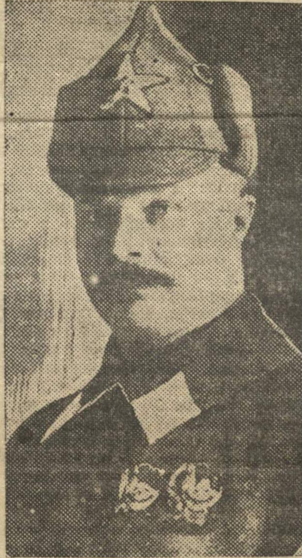
М. В. ФРУНЗЕ.