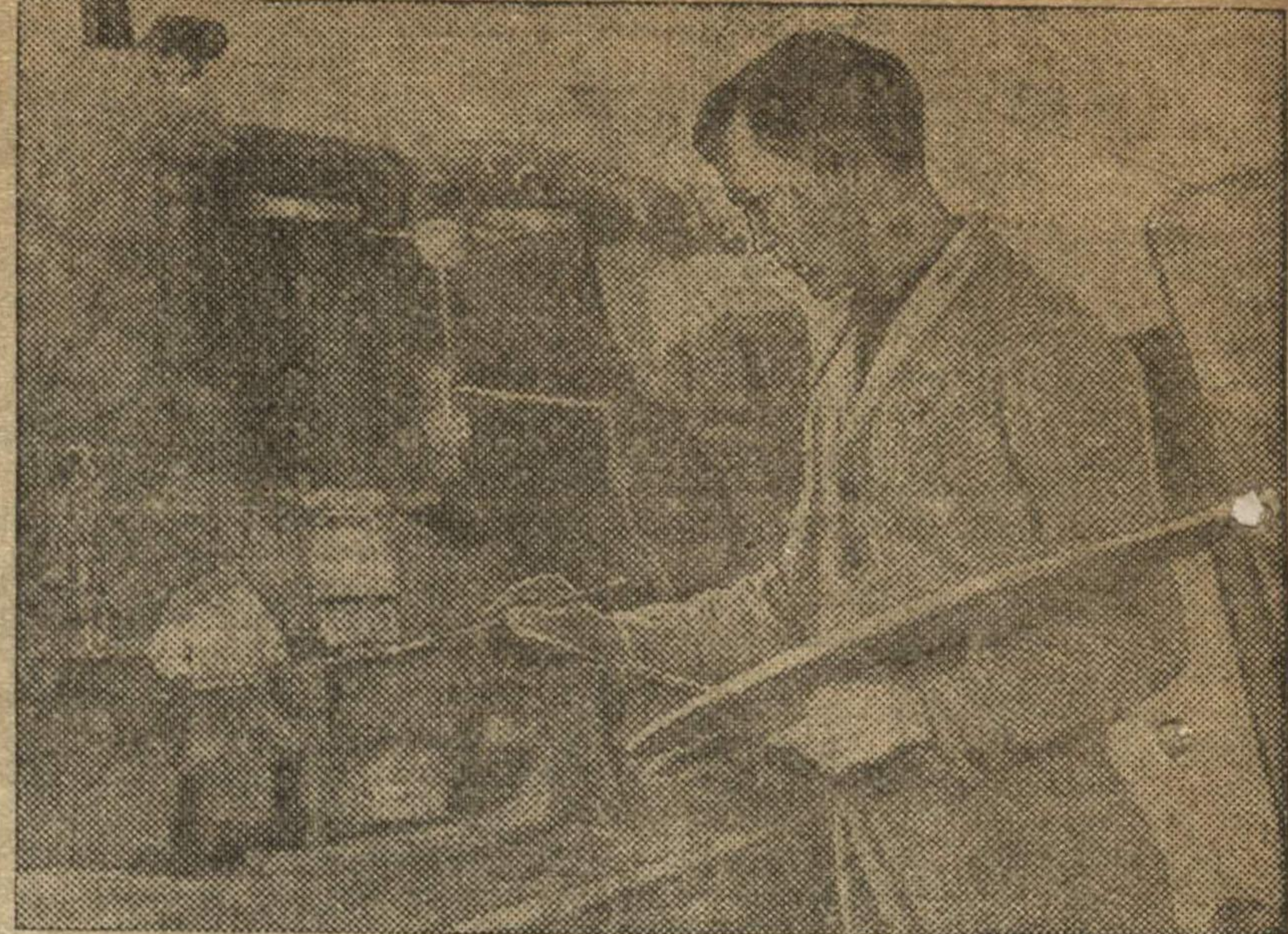
НА СНИМКЕ: художник за работой.