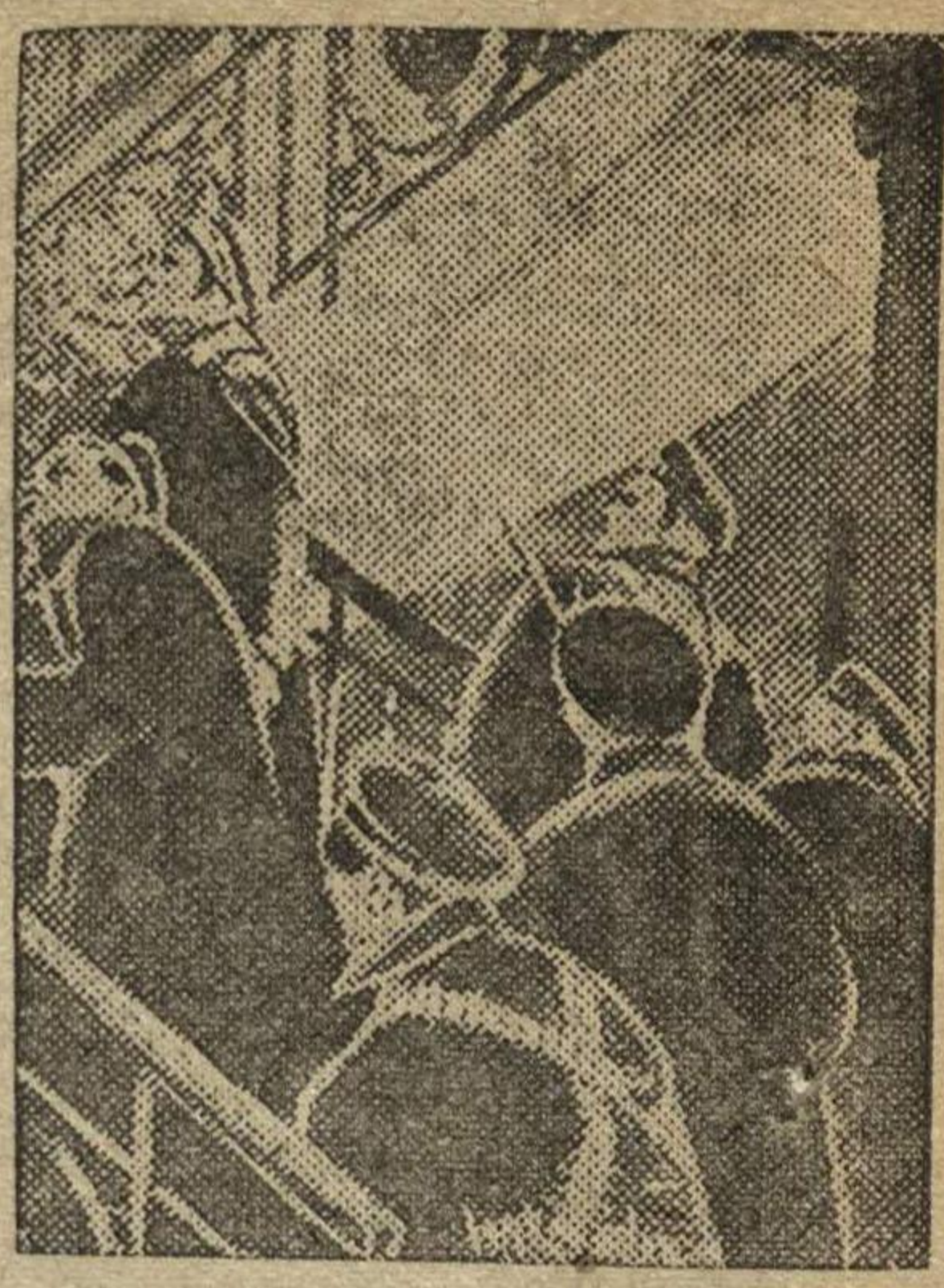
2. Уже матрос Железняк разгнал учредилку

зашиб, затыркал. Забилсь, под галстух — за что им приняться. Как-будто топор навис над затылком. За двести шагов... за тридцать... за двадцать... Вбегае юнкер — «драться глупо». Тринадцать визгов. — Сдаваться! Сдаваться! А в двери — бушлаты, шинели, тулупы... И в эту тишину, раскатившийся властью, бас окрепший, над реями рея — «Которые тут временные?» Слазь! Кончилось ваше время! И один из ворвавшихся, пенсншички тронув, объявил, как об чем-то простом и несложном. «Я, председатель реввоенкомитета Антонов, временное правительство объявляю низложенным». А в Смольном толпа, растопырив груди, покрывала песней фейерверк сведений. Впервые вместо — И ЭТО БУДЕТ... — пели: И ЭТО ЕСТЬ НАШ ПОСЛЕДНИЙ... — До рассвета осталось не больше аршина, — руки лучей с востока взмолены. Товарищ Подвойский сел в машину, сказал устало: «Конечно... в Смольный». Умолк пулемет. Угодил толков. Умолкнул пуль звенящий улей. Горели, как звезды, границы штыков, бледнели звезды небес в карауле. Дул, как всегда, октябрь ветрами. Рельсы по мосту вызмеив, гонку свою продолжали трамы, уже — при социализме. Владимир МАЯКОВСКИЙ. (Из поэмы «Хорошо»).