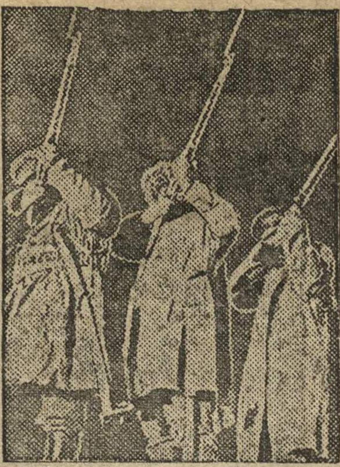
1. Наступали боевые дни.