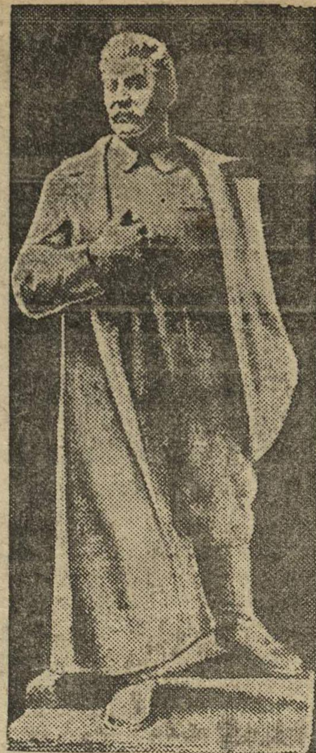
СТАЛИН. Скульптура С. Меркурова

Октябрьский переворот — ярчайшее событие в истории человечества. И пусть вся наша молодежь знает, как большевики в исторический день седьмого ноября 1917 года с оружием в руках завоевали счастье миллионов