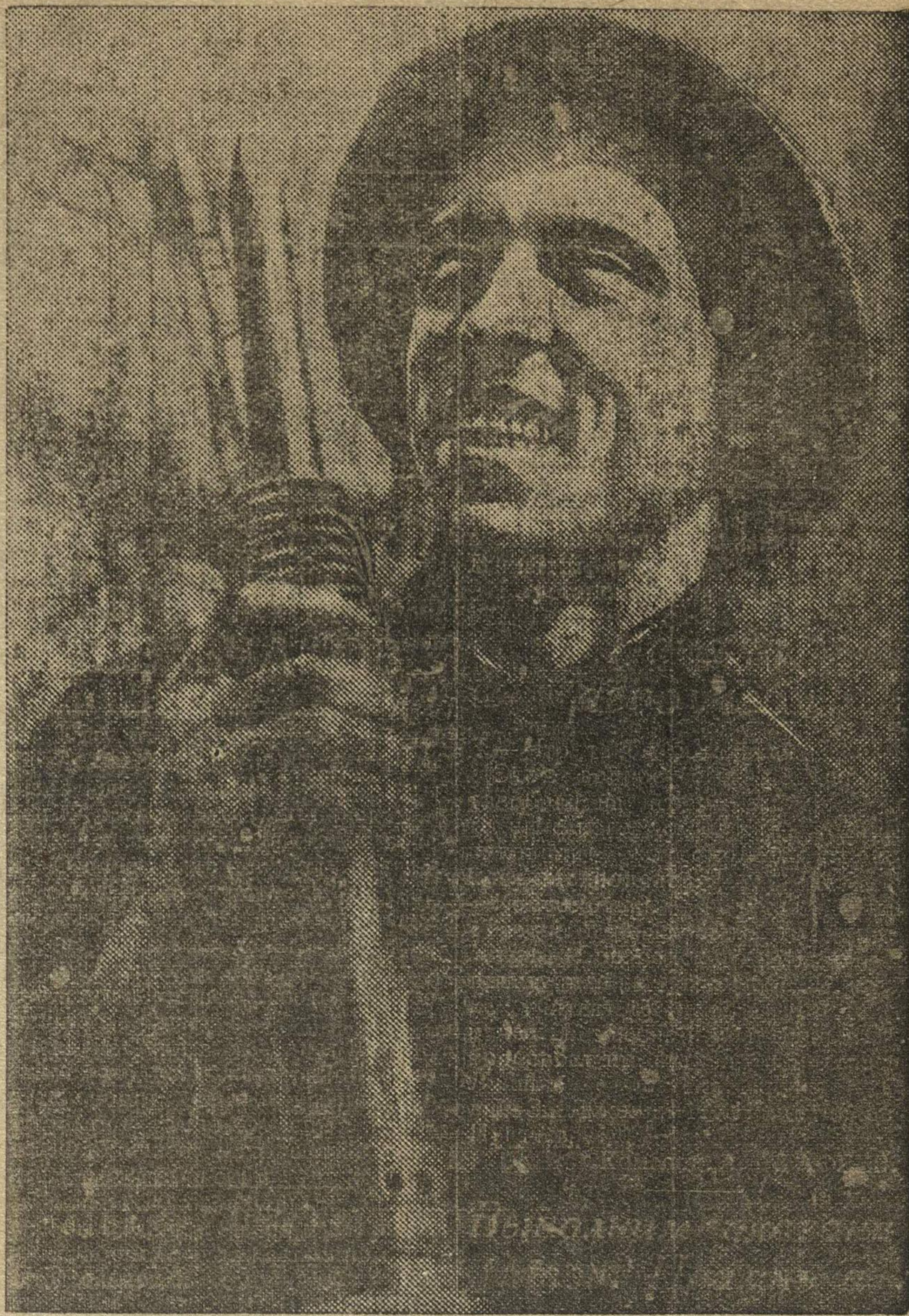
Герой Донбасса — забойщик АЛЕКСЕЙ СТАХАНОВ.