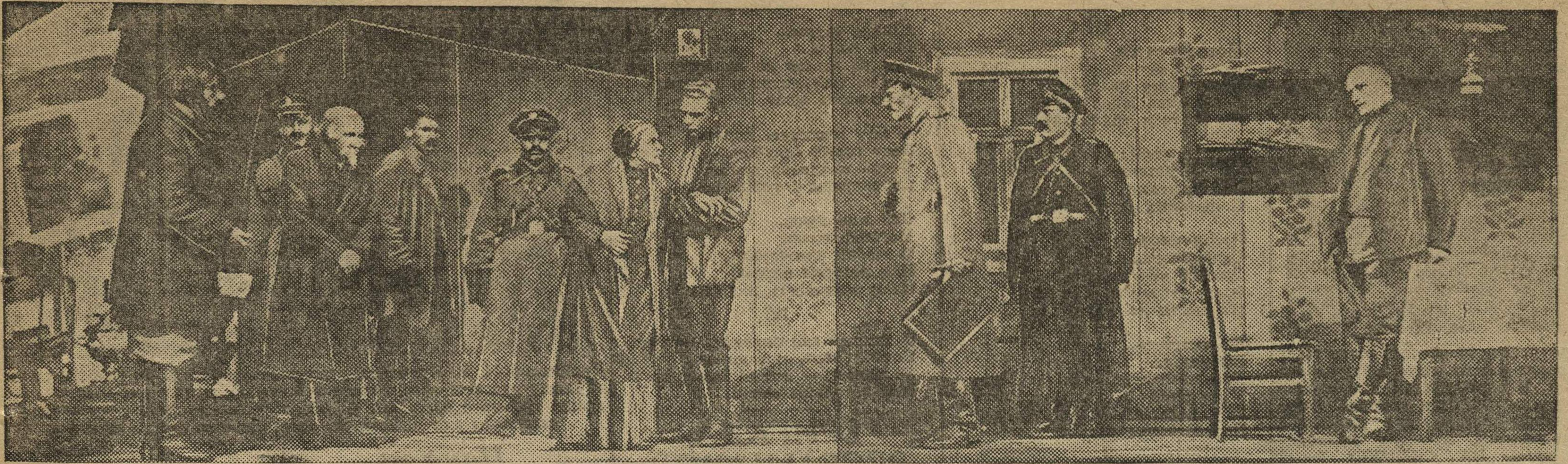
СЦЕНА ИЗ ПЕРВОГО АКТА ПОСТАНОВКИ «МАТЬ».