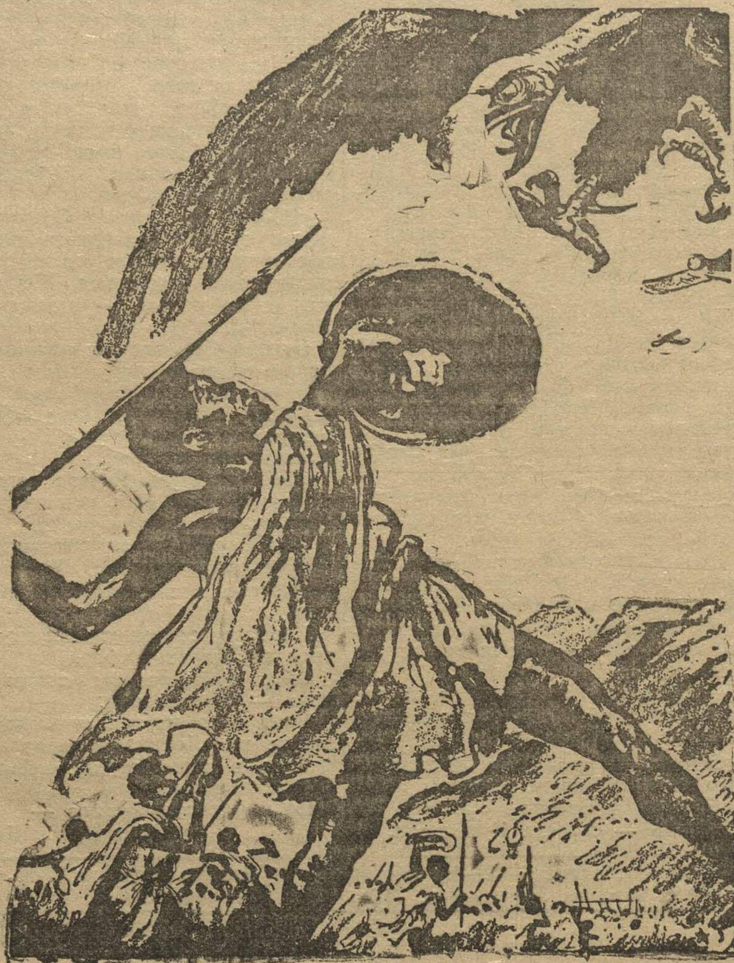
Рис. Фреда Элписа.