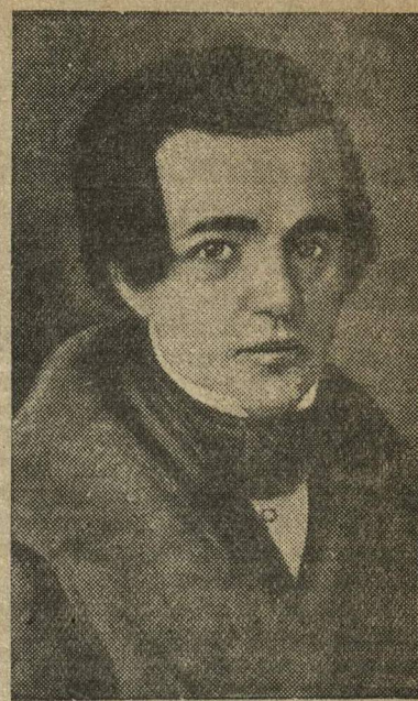
А. В. КОЛЬЦОВ