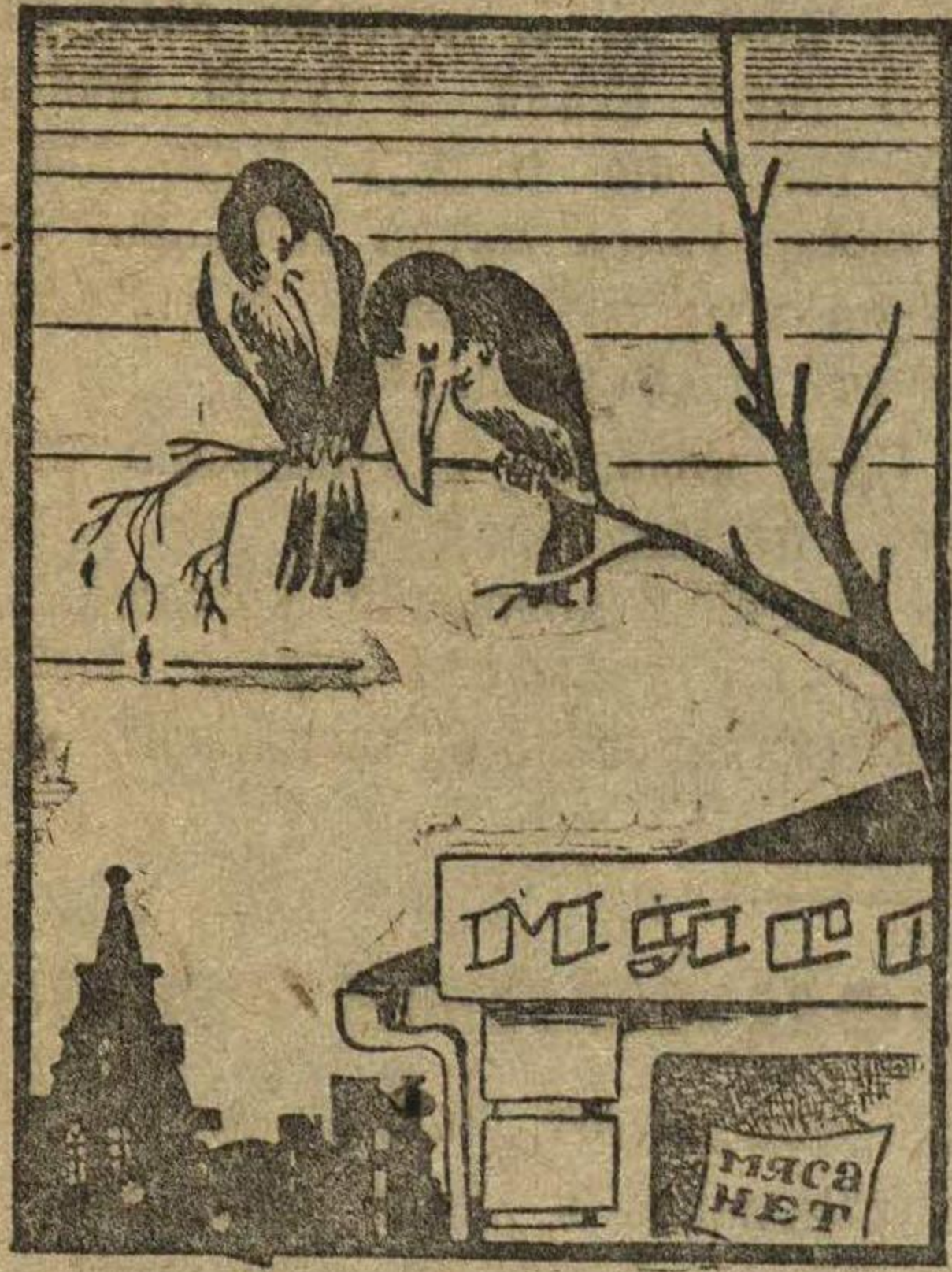
Рис. Н. ГОЛОВИНА.

— Полетим-на, подружка, из этой Третьей империи, а то я чувствую, что из нас рябчиков сделают.