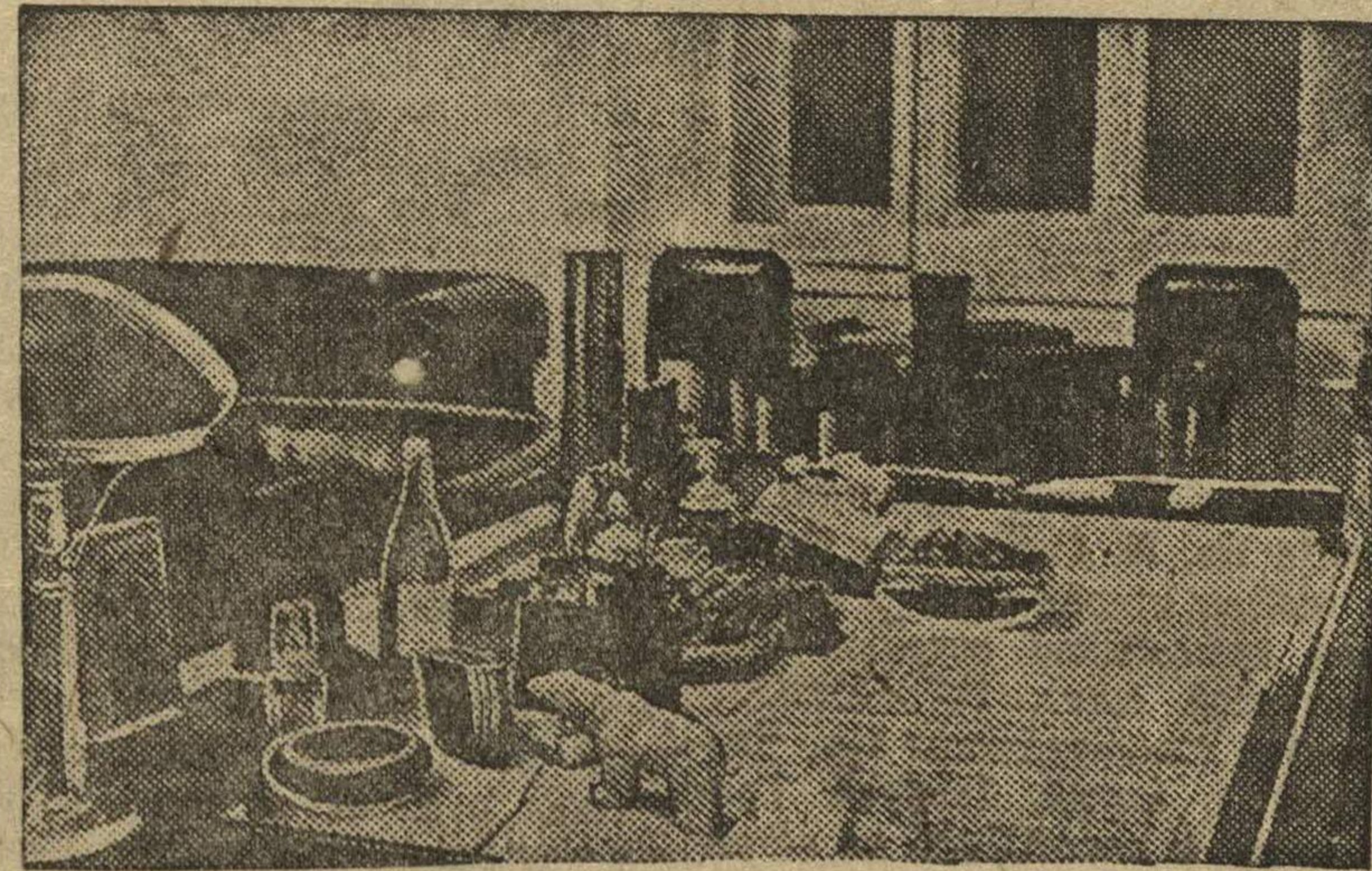
КОМНАТА С. М. КИРОВА В СМОЛЬНОМ.

Здесь мы видим образцы железа, цинка, никеля, меди, апатитов,