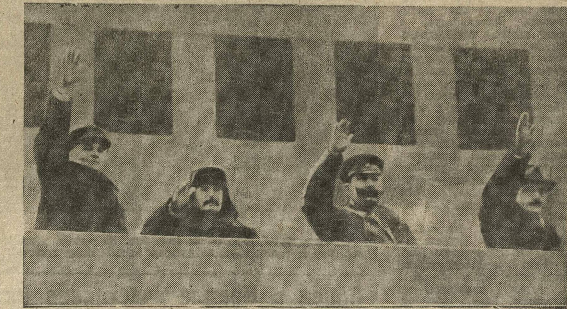
Празднование XXII годовщины Великой Октябрьской Социалистической Революции в Москве. На снимке: руководители партии и правительства с трибуны мавзолея приветствуют колонны демонстрантов. Слева направо: товарищи Шкирятов, Сталин, Буденный, Молотов. (Передано по фототелеграфу).

Войска украинского и белорусского фронтов, выполняя волю своего правительства и приказы командования, проявили немалую