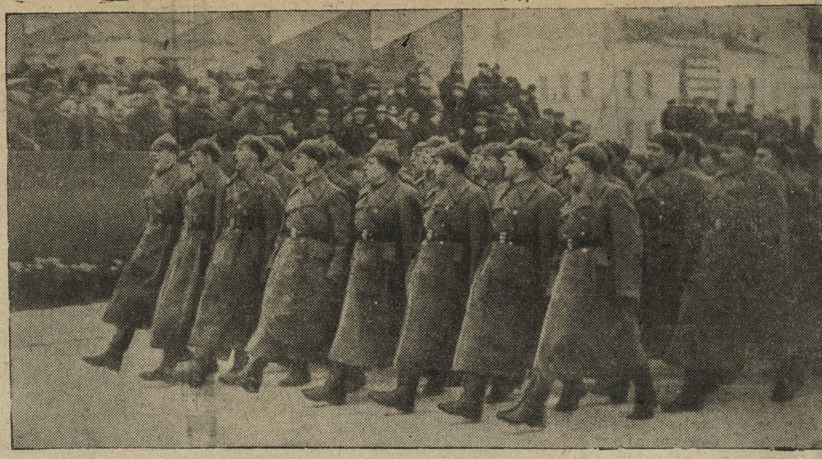
Парад частей Горьковского гарнизона. На снимке: курсанты Военно-политического училища им. Фрунзе проходят церемониальным маршем перед трибуной.