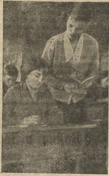
В ШКОЛЕ: урок начался.

Он узнает, что ребята в те страшные времена росли, не зная книг, не держали в руках вот такого красивого пенала. Они вместе с отцами уходили утром на помещичьи поля, огороды. Детские руки извлекали из колхозной осенней земли помещичье богатство — мор-