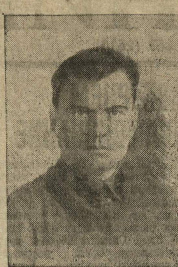
ГУБИН В. В., врид. начальника областного управления НКВД по Горьковской области.