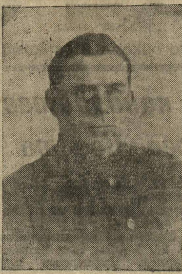
ШУМИХИН М. С., секретарь обкома ВКП(б).