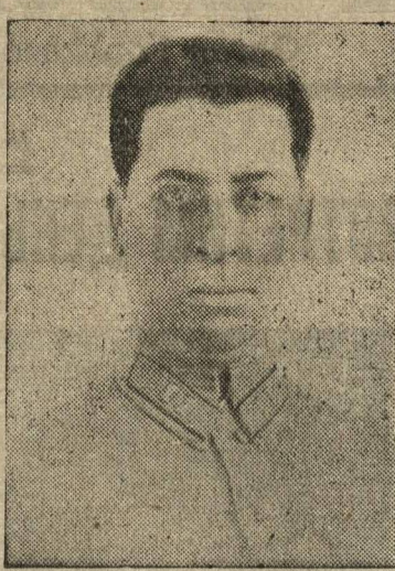
Тенкинский избирательный округ № 103. Альтгольд Александр Яковлевич — начальник областного управления РК милиции.