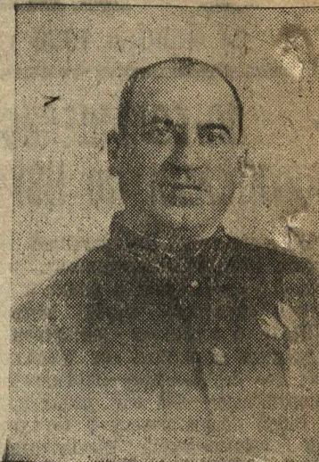
Шахунский избирательный округ № 109. Пономарев Григорий Болотникович — начальник Горьковской железной дороги.