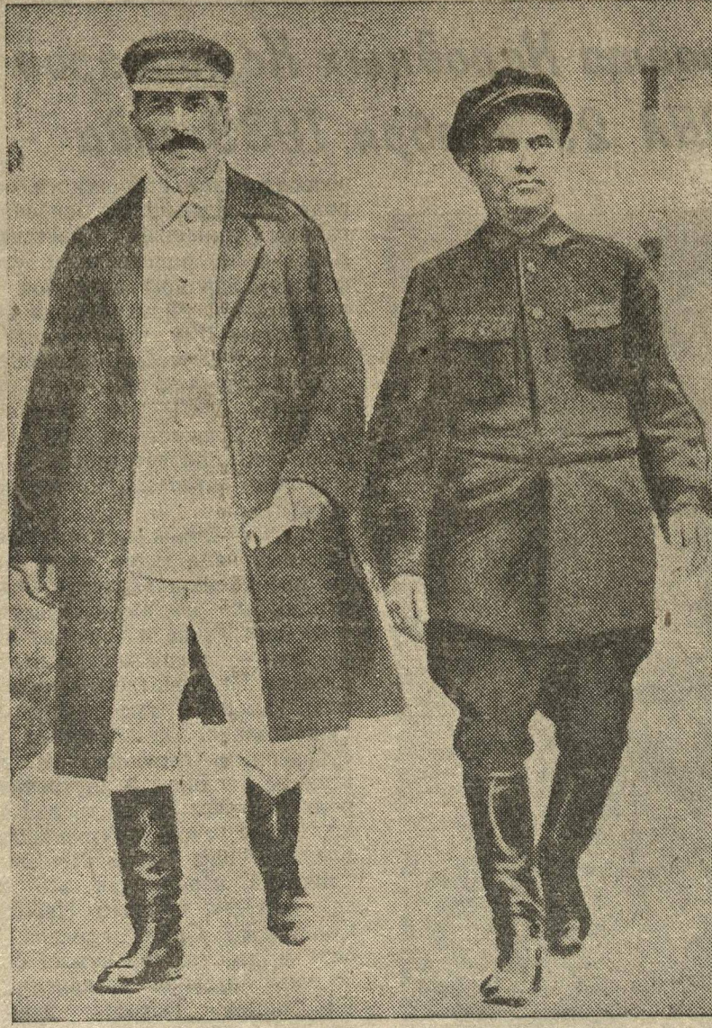
И. В. Сталин и С. М. Киров в Кремле.