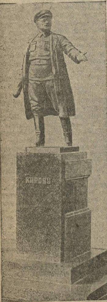
Памятник С. М. Кирову. (Работа скульптора Пинчука).

В истории гражданской войны одной из прекраснейших страниц является героическая оборона Астрахани в 1919 году под руководством С. М. Кирова. Полчища генерала Деникина, подерживаемые и снабженные английской французской буржуазией, захватили весь юг России. Они продвинулись далеко на север в направлении Астрахани. С моря его поддерживали военные английские корабли. Астрахань оказалась в кольце. В городе подготовлялись контрреволюционные мятежи, во главе которых стояли белогвардейские офицеры. Киров сумел раздразнить мятежников. Он превратил Астрахань в настоящую советскую крепость на Волге, которую Деникину так и не удалось взять. Героическая XI Красная армия под руководством Кирова нанесла ряд сокрушительных ударов Деникину и весной 1920 г. освободила весь Северный Кавказ от белых банд. После окончания гражданской войны Сергей Миронович, будучи секретарем ЦК коммунистической партии Азербайджана, восстанавливает бакинскую нефтяную промышленность. Вместе с Серго Орджоникидзе он принимает горячее участие в создании Северо-Кавказской республики и Закавказской Федерации народов Кавказа.