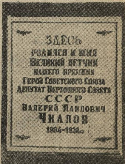
14 декабря в Чкаловске у дома, в котором родился и жил великий летчик нашего времени В. П. Чкалов, состоялся митинг, посвященный памяти народного героя. На снимке: выступление на митинге ближайшего друга В. П. Чкалова, его боевого товарища по перелетам, Героя Советского Союза Г. Ф. Байдукова. Слева — мемориальная доска, прикрепленная к дому, где родился и жил В. П. Чкалов.