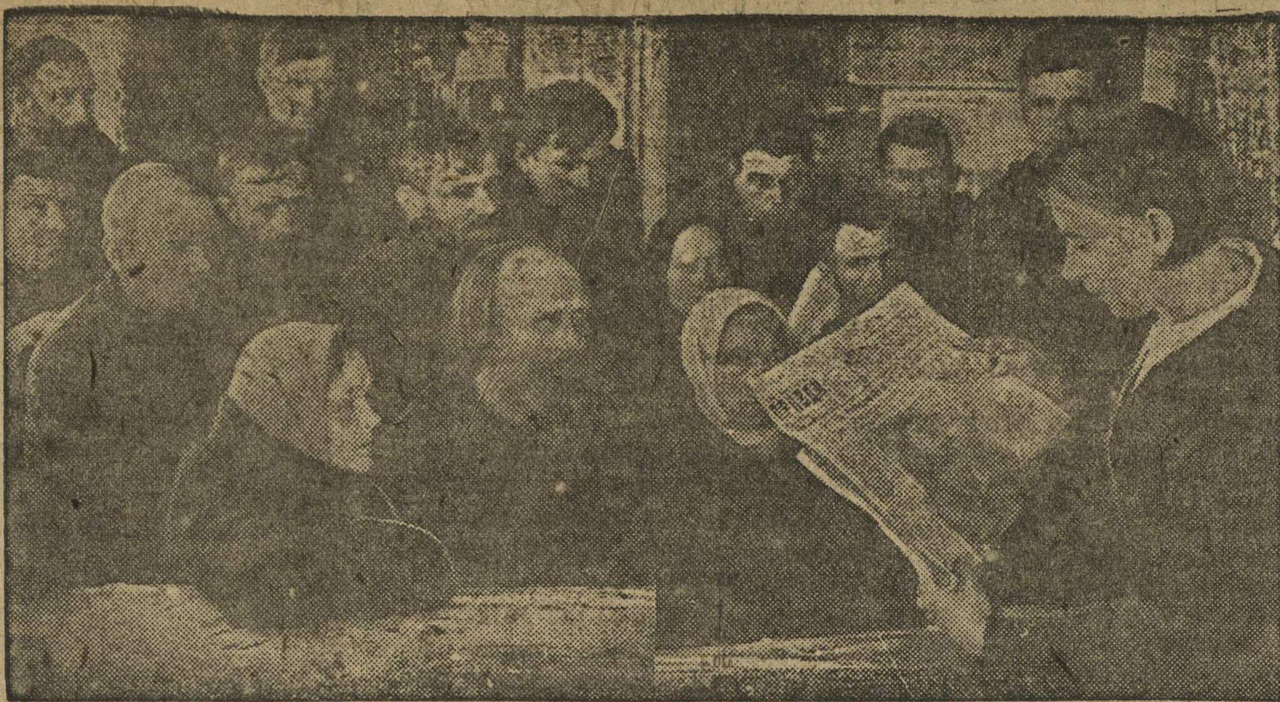
На снимке: проработка в колхозе «имени 1 мая» речи т. Сталина, произнесенной на совещании передовых комбайнеров и комбайнеров (Московская область).