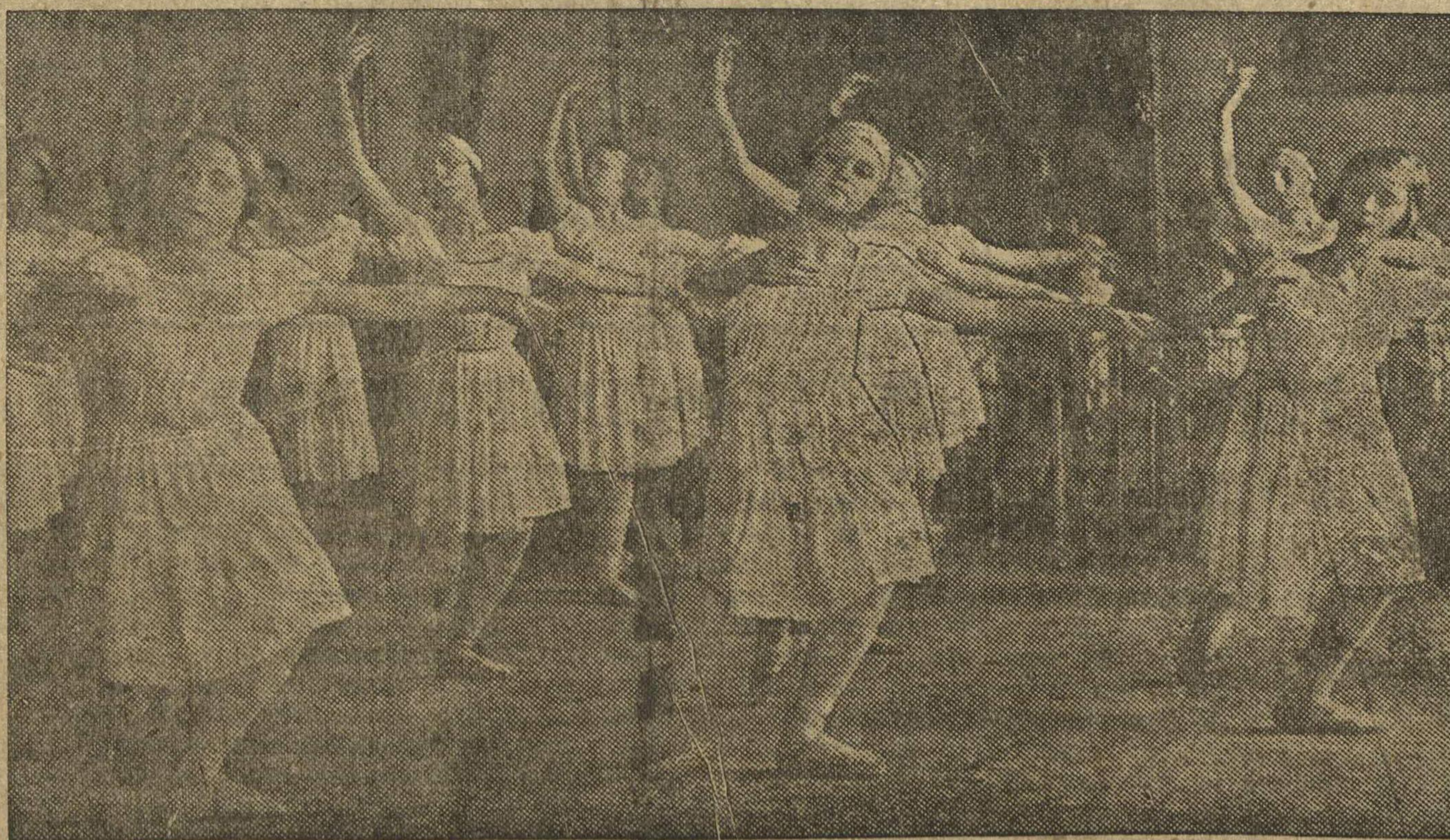
Ленинградский хореографический техникум готовит кроме исполнительниц, также и педагогов для домов художественного воспитания детей. На снимке: урок классического танца в 6 и 7 классах.

Отв. редактор Д. С. ЛУКИН. Издатель: ИЗДАТЕЛЬСТВО «ГОРЬКОВСКАЯ КОММУНА».