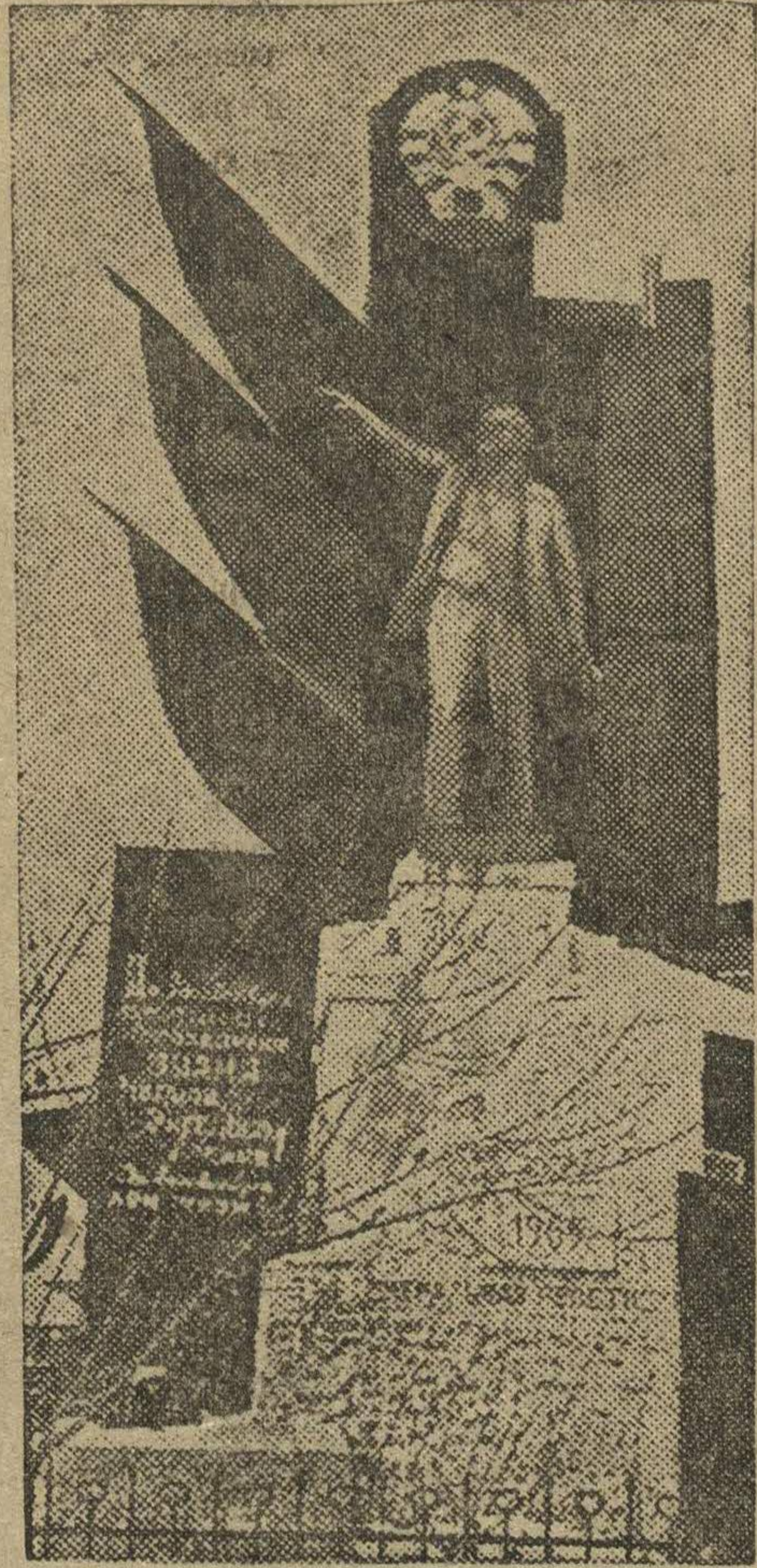
Памятник В. И. Ленину, поставленный на месте сормовских баррикад.