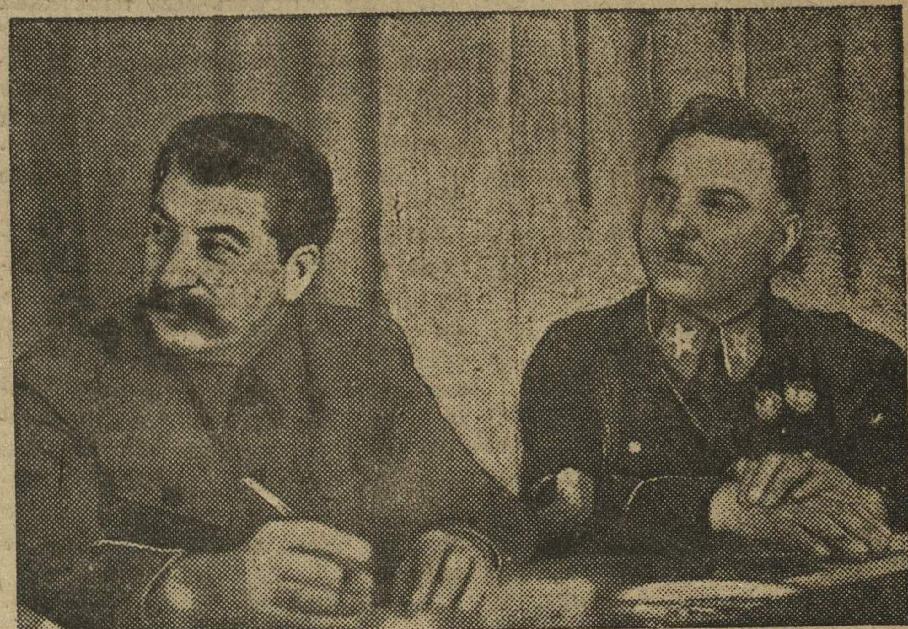
Т. СТАЛИН и ВОРОШИЛОВ на совещании передовых колхозников и колхозниц Узбекистана, Казанстана и Кара-Калпаки с руководителями партии и правительства

Для выработки технических норм и пересмотра мощностей предприятия Наркомлегпрому в течение первого полугодия 1936 года создать отраслевые производственные конференции в составе директоров предприятий, главных инженеров, начальников цехов, мастеров, подмастеров и лучших стахановцев, закончив эту работу к моменту составления производственных планов на 1937 год.