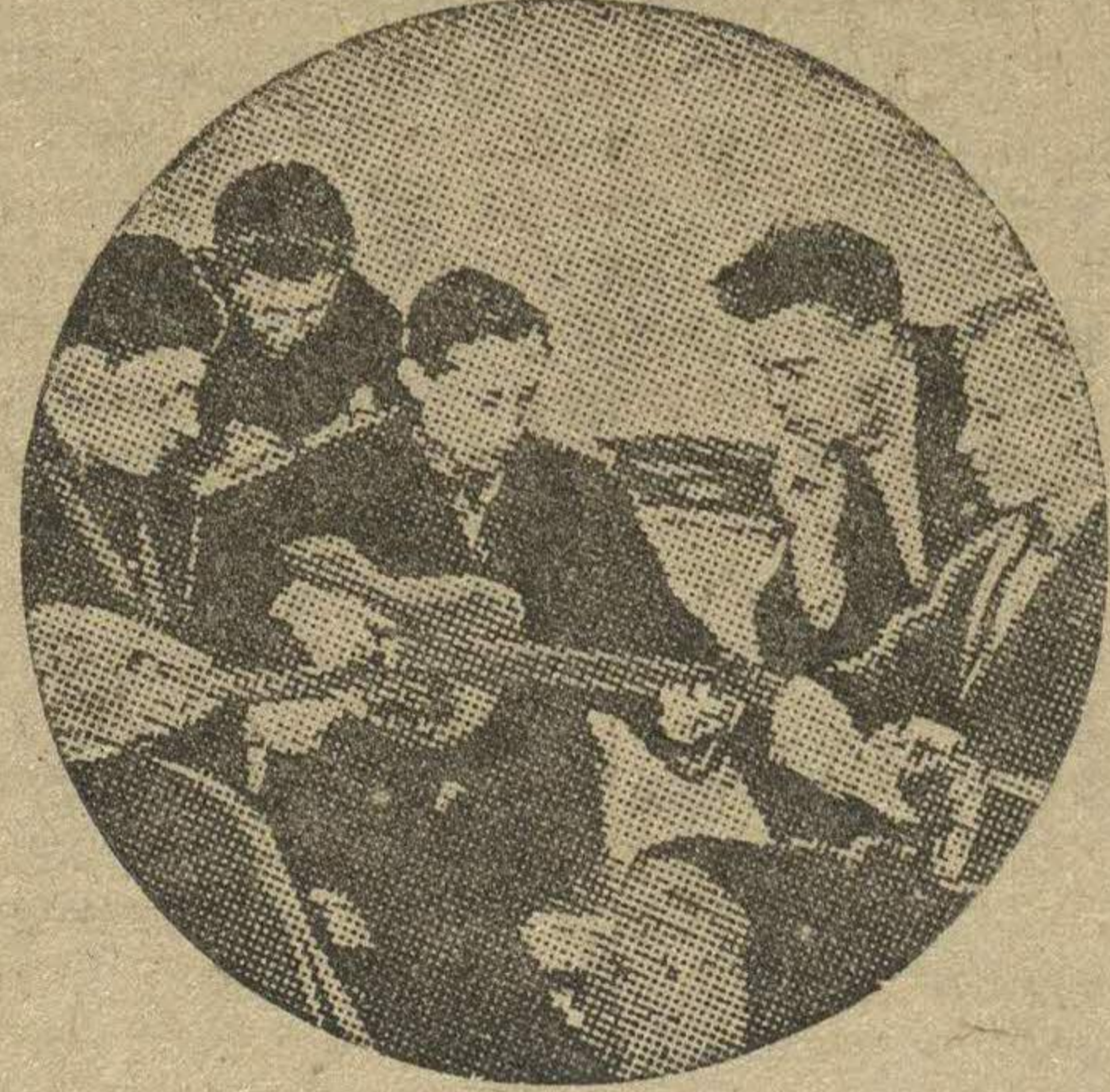
Окончен трудовой день. После обеда в общезнании комсомольцев-арматурщиков молодежь решила повеселиться. НА СНИМКЕ: участники струнного кружка разучивают новые песни. (Стройгаз).

По сбору книг для сельских библиотек Мзынский район занял одно из первых мест в городе. Вместо 3000 книг по контрольному заданию, собрано 6200.