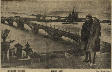
ВЕЧЕРНИЕ ИГРУДЫ. Осенний пост.

В мае уехали из Москвы И. П. (разные) и С. С. (разные) в горы. В мае уехали из Москвы И. П. (разные) и С. С. (разные) в горы.